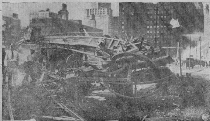
Este es un aspecto del desastre ocurrido recientemente en Chicago. Un tren de pasajeros y un carro extinguidor de incendios colisionaron a escasas cien yardas de un cruce.