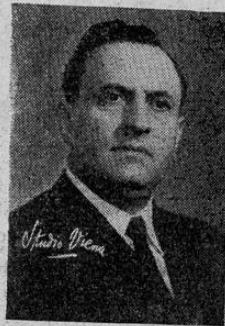
Dr. CALDERON GUARDIA

De interés para los ganaderos nacionales, es el mensaje que recibimos de la United Press, y que dice: