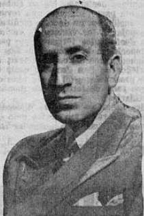
Don JOAQUIN FERNANDEZ

LAKE SUCCESS 11, (UP). Se tiene entendido que Joaquin Fernández, ex-Ministro del Exterior de Chile, es uno de los tres candidatos para el puesto de gobernador de Trieste. El Sub-Comité del Consejo de Seguridad compuesto de Australia, Colombia y Polonia, tiene tres candidatos que se dice son, Augusto Buisseret, ex-Ministro del Interior de Bélgica, Theodor Boch, Diputado noruego y Fernández.