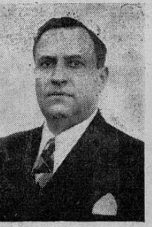
DR. CALDERON GUARDIA

Recomendamos escuchar las opiniones del doctor Calderón Guardia sobre esta trascendental materia.