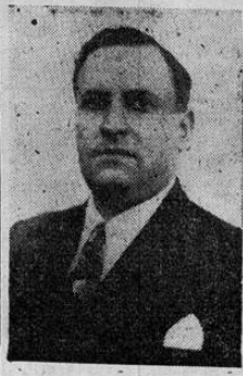
DR. CALDERON GUARDIA

El interés es inmenso por oír las palabras trascendentales del próximo presidente de la República.