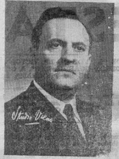
Doctor CALDERON GUARDIA

ESTE DISCURSO SE RETRASMITIRA DESDE LA ESTACION “RADIO PARA TI” A LAS 9 pm.