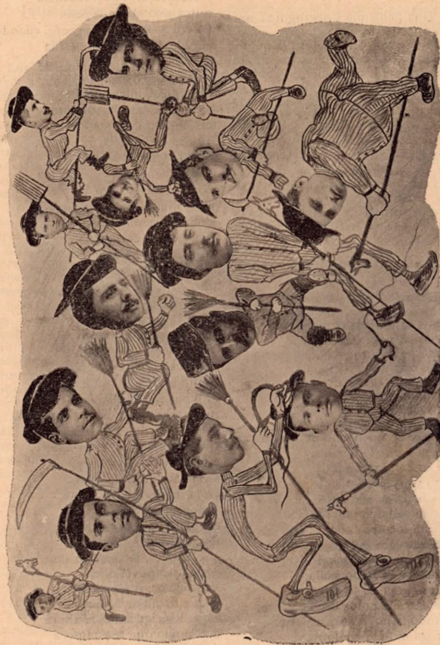
Una gota de agua de las últimas lluvias, vista con el microscopio