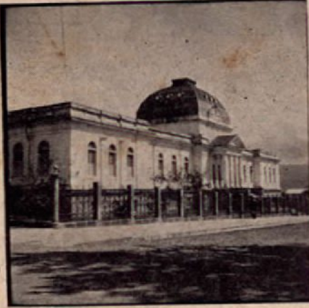
Colegio S. Luis Gonzaga (Cartago)