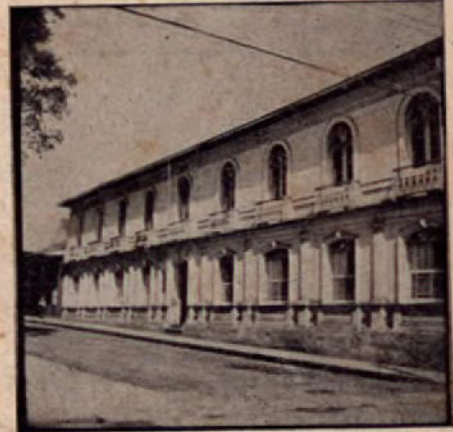
Instituto de Alajuela

Suscripción anual ..... ₡ 1.00 Número suelto ..... ₡ 0.10