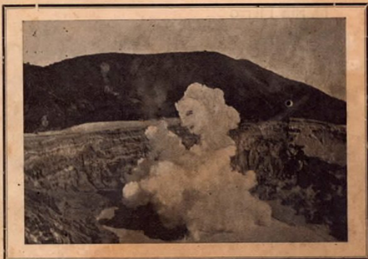
¡UNA SILUETA DE GASES VOLCÁNICOS!

::: DE LA JUVENTUD ESTUDIANTIL DE COSTA RICA :::