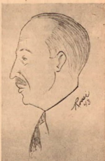
PAUL VAN ZEELAND

Sabíamos que el ex-primer ministro belga señor Paul Van Zeeland, nuestro huésped distinguido de la semana anterior, profesa la fe católica. Pero no realizábamos la cabal significación de ese hecho, antes de conocerlo y oírlo. Lo hemos oído en su discurso pronunciado ante el Congreso Nacional, y lo hemos oído en la Facultad de Derecho. Su fuerte personalidad, su fe en las fuerzas espirituales para la destrucción del poder que actualmente ostenta la fuerza bruta en Europa, y sus realistas y ponderadas apreciaciones con respecto a la venidera época de la post guerra, han hecho nacer en nosotros la satisfacción que se siente cuando uno se encuentra frente a frente con un hombre de convicciones y proceder sincero.