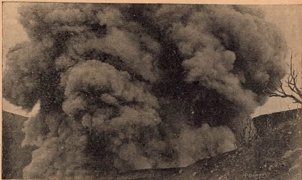
Base de la gran columna a la salida del cráter, 2 de Agosto de 1918.