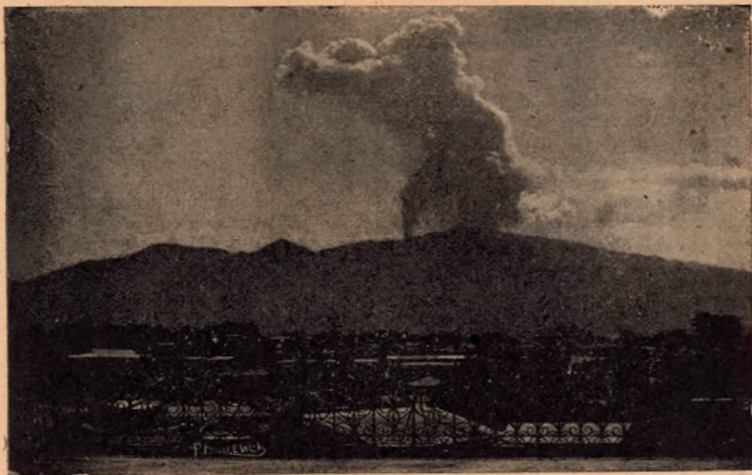
Gran erupción del 25 de Setiembre de 1918, vista desde la Azotea del Colegio

Dirigiendo ahora la vista hacia la cumbre del Tablazo, se ven algunos árboles aislados que, como centinelas, parecen recordarnos cada día, la des-