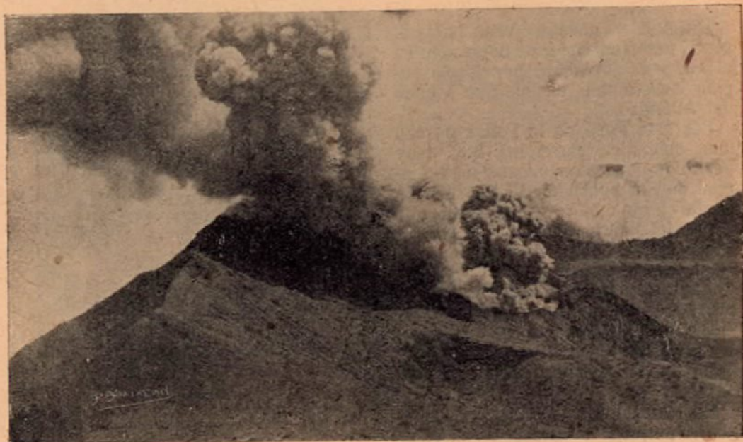
Salida de varias erupciones, 3 de Agosto de 1917.