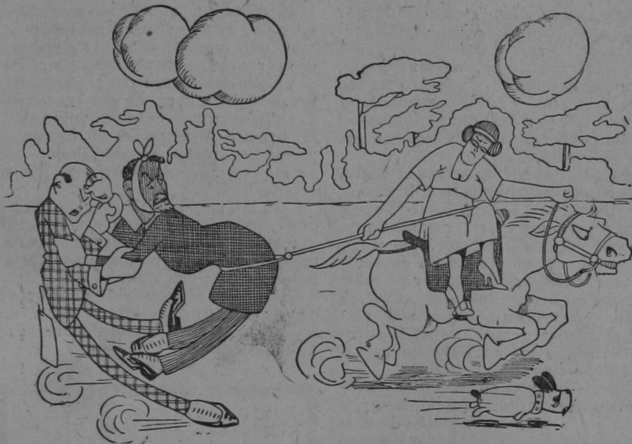
Dibujo de SOLANO

Aquí está mister Ascension agarrándose del partido que últimamente ha revivido sin pies, cabeza, tón ni són.