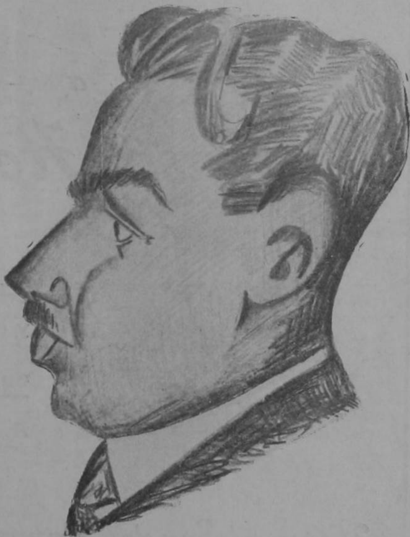
Dibujo de Solano