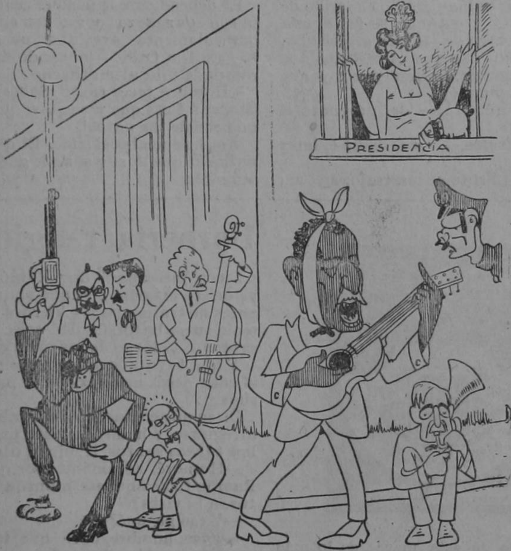
Dibujo de SOLANO