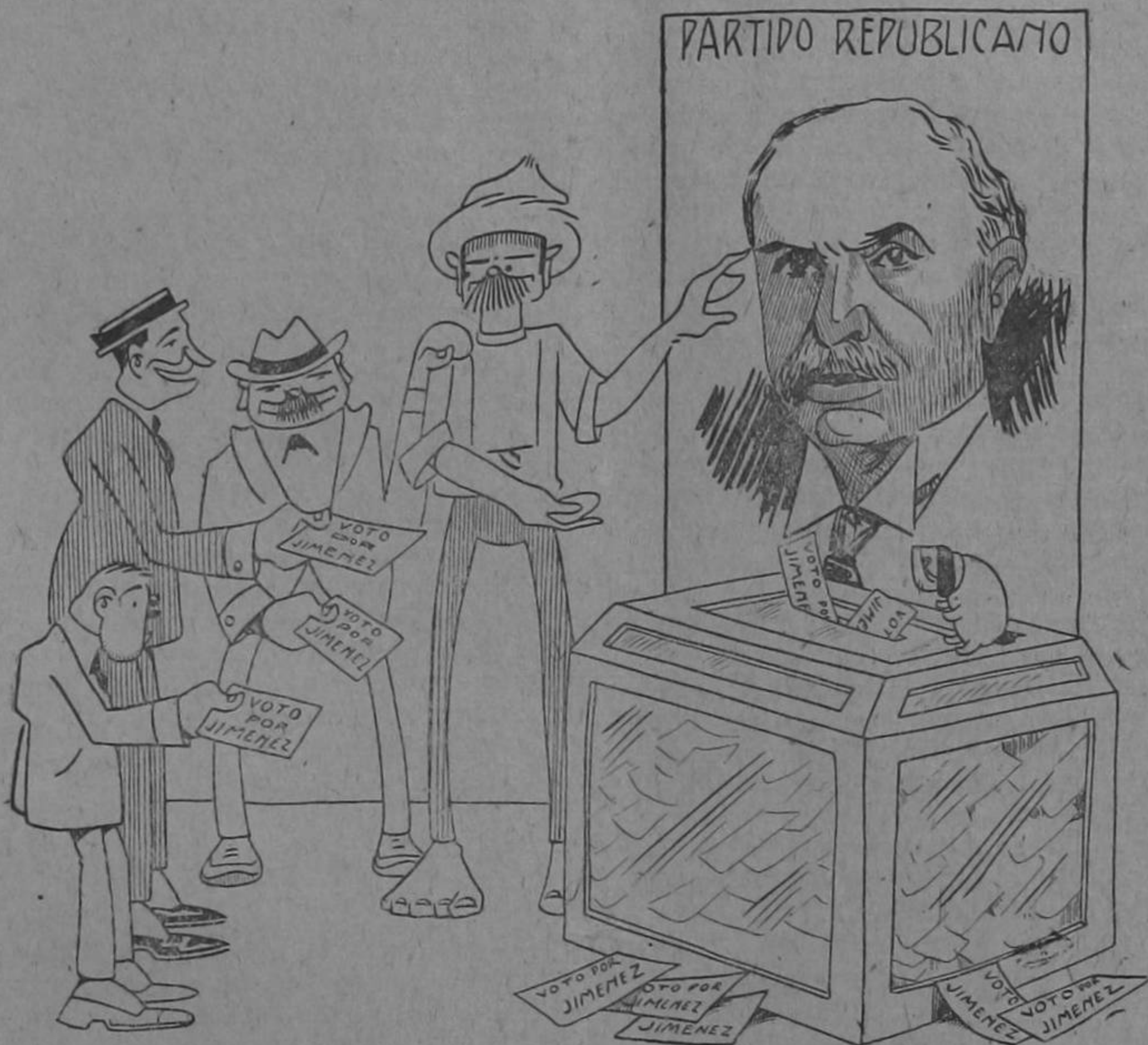
Dibujo de Solano

Tiene el pueblo la confianza absoluta y anhelante de ver en diciembre entrante realizada su esperanza