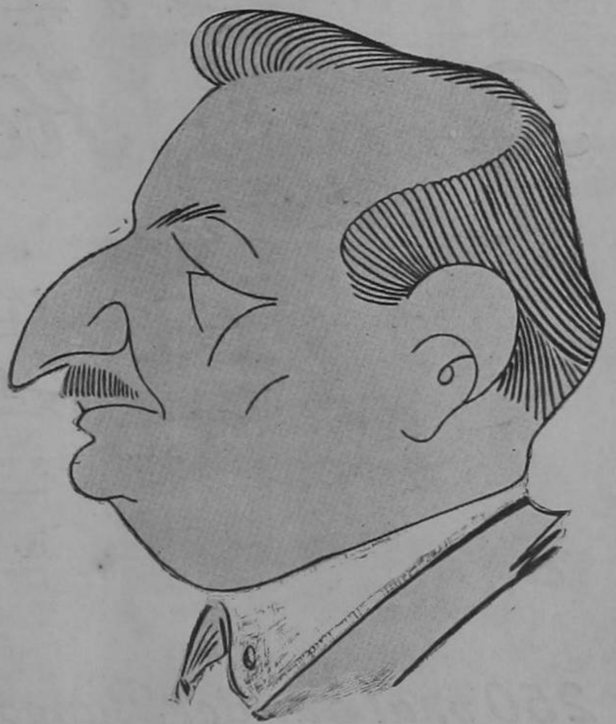
Dibujo de Solano