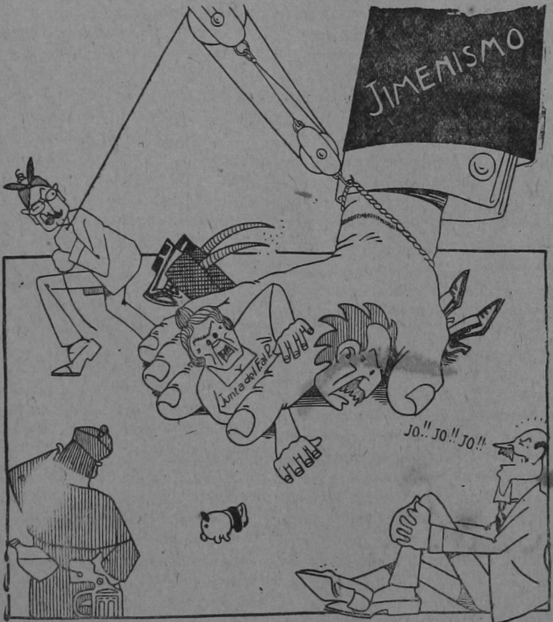
Dibujo de Solano