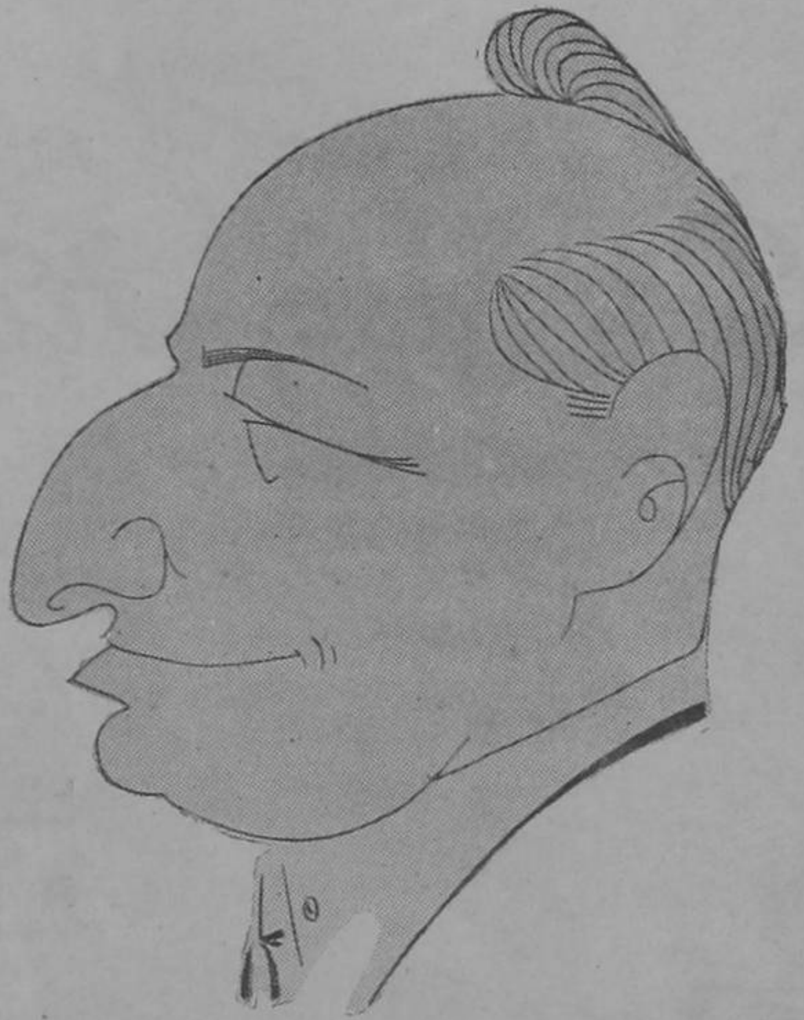
Dibujo de Solano