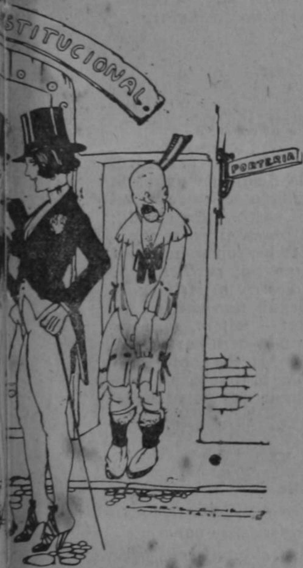
Dibujo de Arteche

Tienen razón nuestras vengativas damas. Si ya la juventud y aun los viejos verdes no pueden salir a la calle sin darse unos golpecitos en la cara con la mota, arreglarse las ojeras y componerse la costura de los calcetines