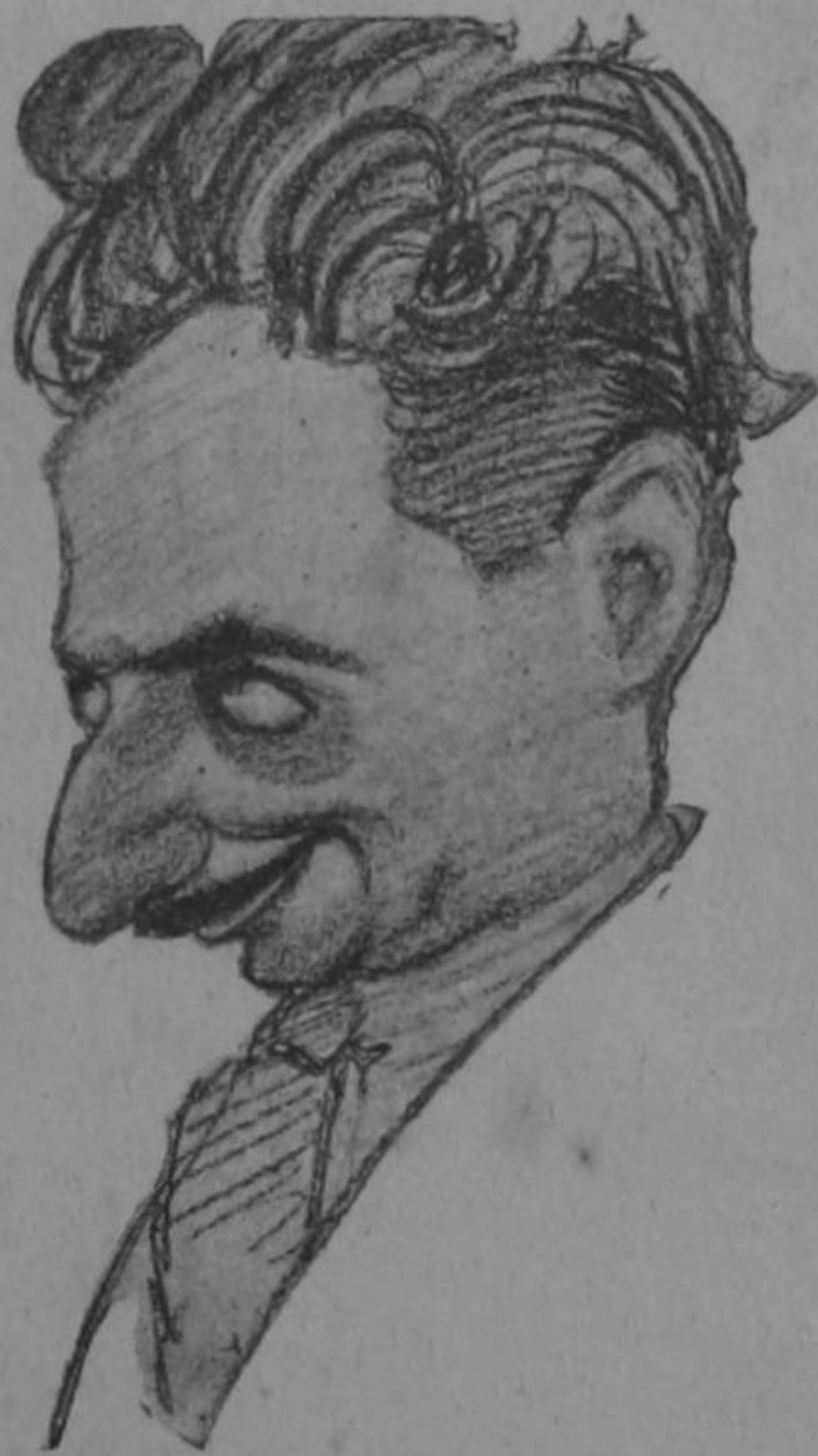
Dibujo de Arteché