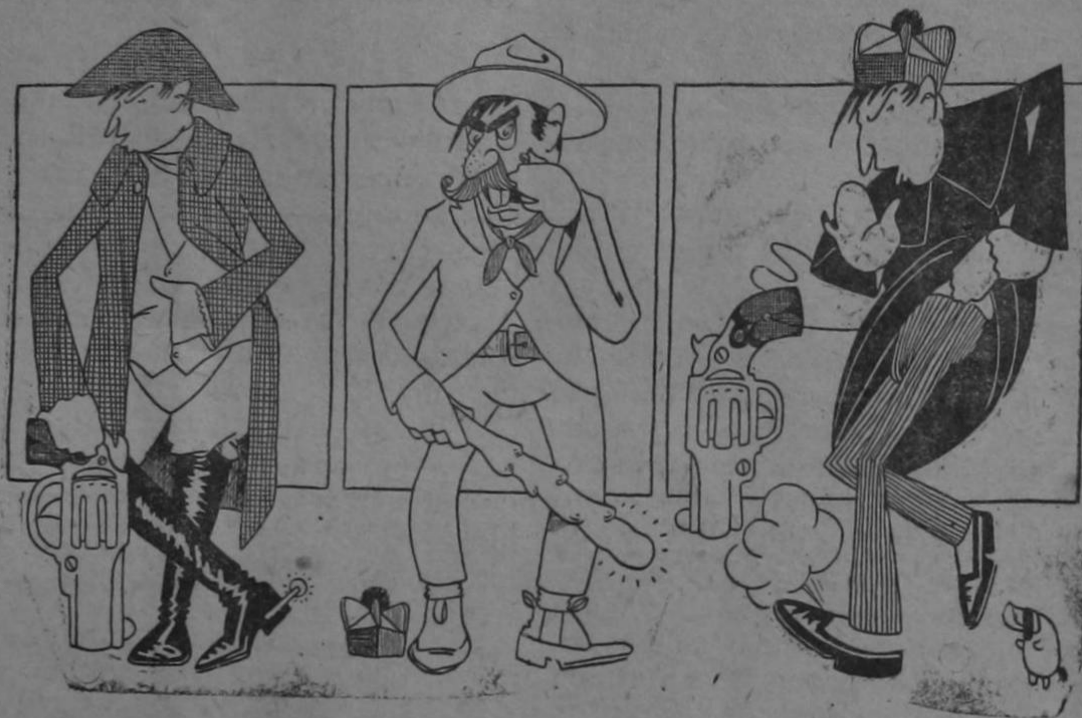
Dibujo de Solano