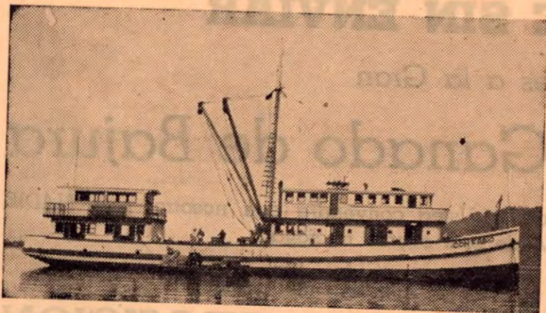
MOTONAVE "DON FABIO"

PUNTARENAS — Servicio de CARGA Y PASAJEROS: GOLFITO Y PTO. JIMENEZ