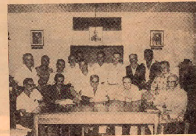
La Directiva en Reunión

Apoyo Moral y económico a entidades culturales y educacionales