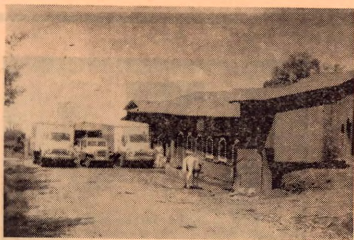
Fotografía de los carros de la Hacienda, Departamento de aclimatación

La leche producida en la Hacienda Palmira es despachada diariamente a sus distribuidores en San José por medio de las unidades motorizadas que se observan en este grabado, así también se puede observar el departamento de aclimatación para ganado de altura en Santa Elena, perteneciente también a la Hacienda Palmira.