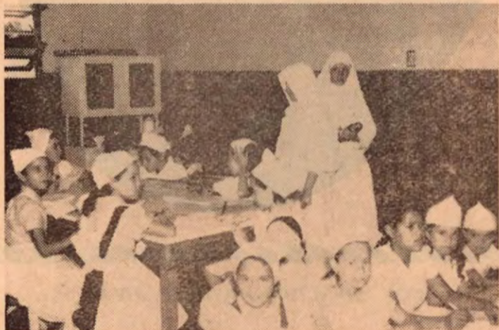
El Colegio de Sión de Turrialba es uno de los mejores Centros educativos del país, está a cargo del Ministerio de Educación, regentado por las Monjitas de Sión