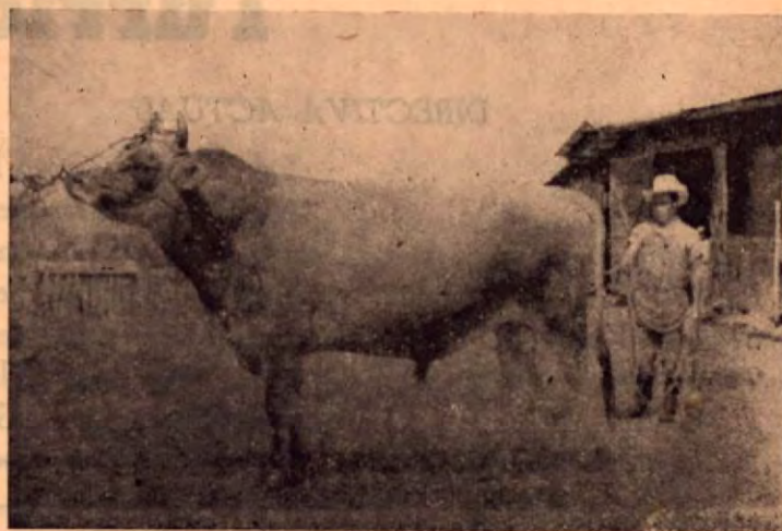
El DICTADOR es uno de los mejores toros con que cuenta la Hacienda PALMIRA; de pura raza Gersey, ha sido registrado en Costa Rica y en los Estados Unidos de América

La Hacienda Palmira está colocada a la altura de la responsabilidad que el deber le impone: producir para servir al público, leche y sus productos de primera calidad.