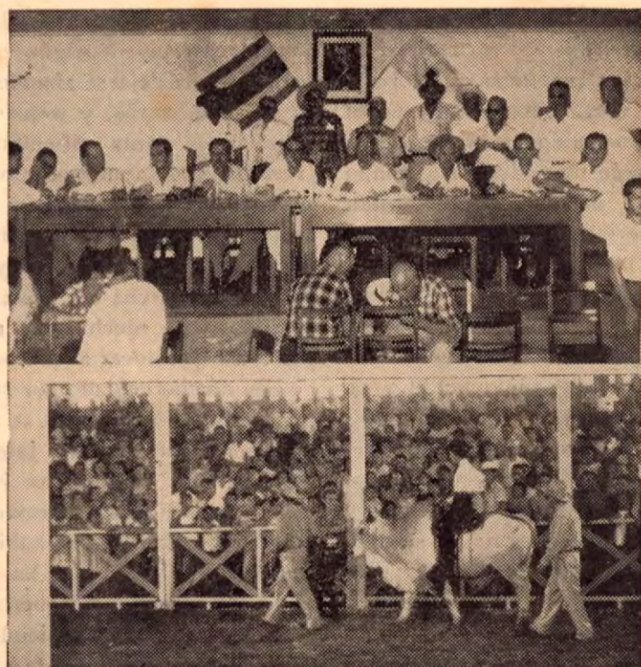
Parte superior: Tribuna de Cámara de ganaderos en su fiesta de la inauguración del edificio.