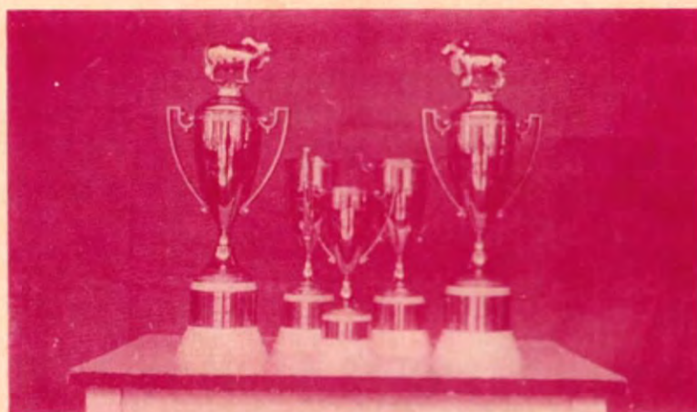
Fotografía de los trofeos obtenidos en recientes exposiciones

Pero siempre en acción renovadora y a la cabeza de un programa de selección en todas actividades del AGRO, la