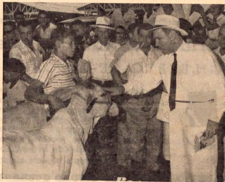
El Sr. Presidente en la Exposición