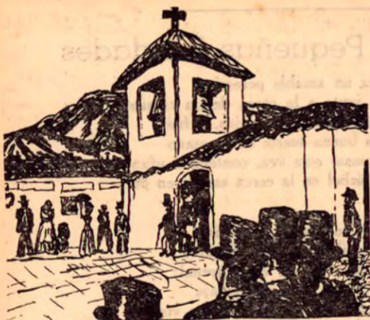
La antigua iglesia La Merced