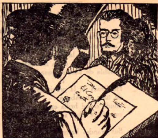
Firma del Protocolo

El primer Congreso Constitucional que tuvo Costa Rica, hoy Asamblea Legislativa, se instaló el 6 de setiembre de 1824, es decir, hace ciento treinta y cinco años, en la ciudad de San José, día designado con anticipación por el Decreto de 5 de mayo del mismo año.