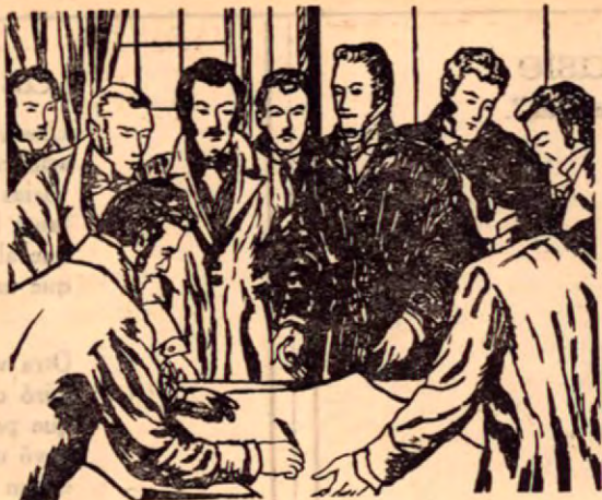
Firma de los Diputados