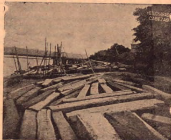
Madera en el puertecito de embarque

Una empresa al servicio del desarrollo industrial de la madera en Costa Rica.