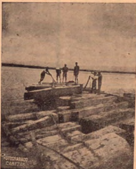
Amarre de la madera en el río.

Nuestras maderas son distribuidas por las casas ms serias en el ramo en SAN JOSE, como el