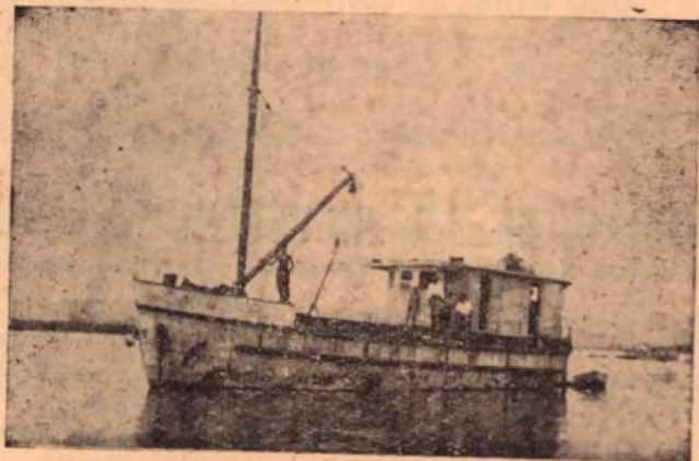
Lancha LA GAVIOTA