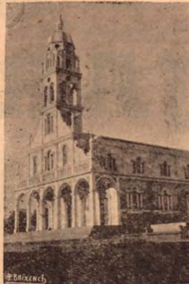
Iglesia de la Agonía

El 3 de mayo de 1928, se proponen las bases para la erección de un convento religioso en La Agonía y se hace efectiva la idea. Pronto se principiaron los trabajos para levantar la casa cural y al si-