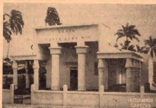
Vista de la nueva Logia masónica de Turrialba.