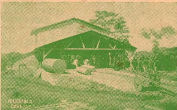
Acarreo de las tucas al aserrío

Entrega inmediata al domicilio de nuestros clientes en San Isidro