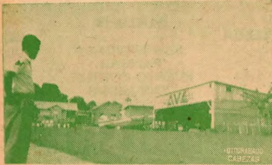
Hangares de "A-VE" en el Campo de Aterrizaje de San Isidro

Allí hay una Unidad Sanitaria bien dotada y hermosa. Funciona la Cruz Roja organizada por la J.O.C., presidiéndola el Doctor Mariano Figueres; allí está la proyectada Escuela Vocacional y la Escuela Complementaria creada por Decreto N°