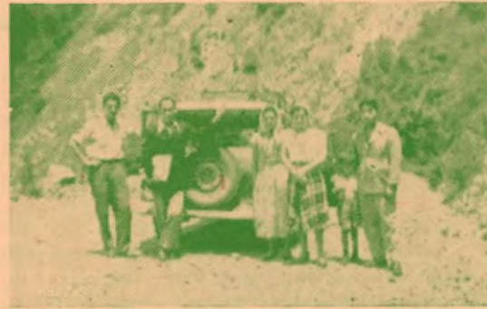
Un receso en el camino a San Isidro del General al pasar por el cerro de la Muerte.

"Los primeros que se cree llegaron al General fueron: don Pedro Calderón y don Manuel Estrada, quienes hicieron un trillo por la montaña, saliendo de San Marcos de Tarrazú y lle-