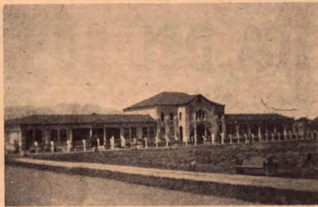
Edificio escolar de Santo Domingo de Heredia