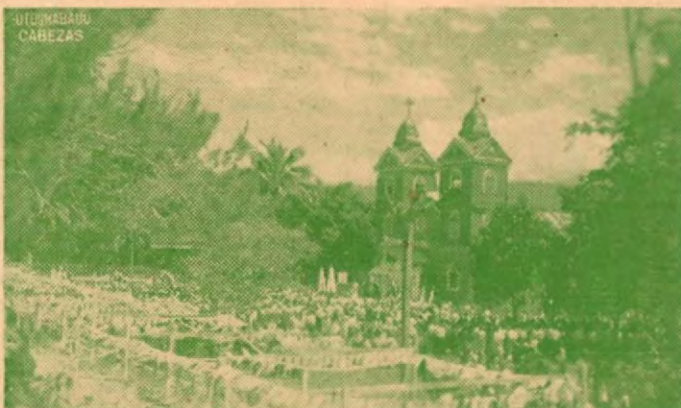
La Iglesia está de fiesta

Casi en la cresta hubo un instante de despeje de la neblina y uno que otro rayo de sol se metió entre los flecos del panorama frío de la mañana. El chofer paró el carro y por unos minutos nos permitió salir. Estamos a 9917 pies sobre el nivel del mar, a decir de uno de los pasajeros que