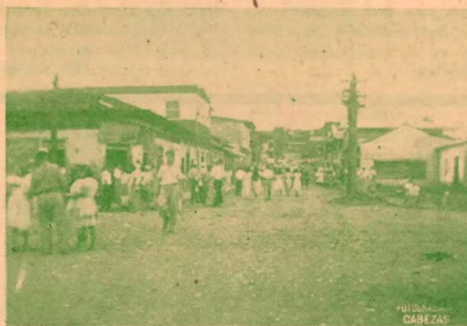
Una calle de San Isidro