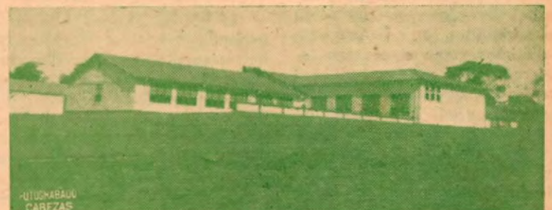
Edificio escolar de San Isidro

Ya tiene el turismo de gusto del país su sitio de confianza y de esparcimiento en SAN ISIDRO DE EL GENERAL. Visite el