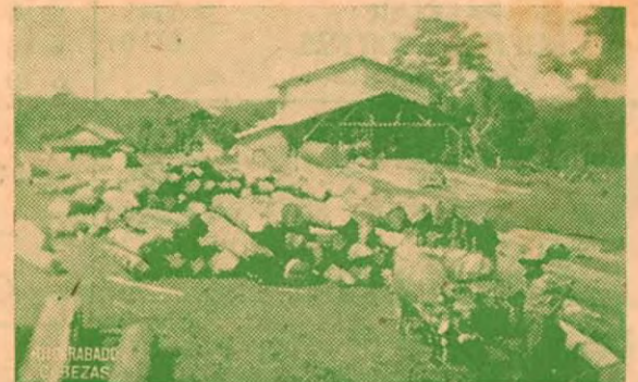
Patio de la madera, y aspecto general