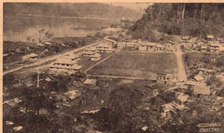
Preciosa vista de Golfito, población civil.