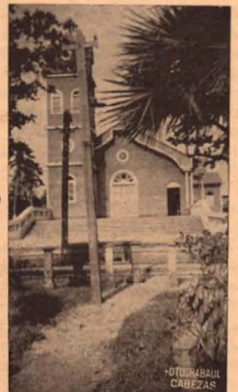
Iglesia de Cañas-Guanacaste

constituirme en escultor, arte que aprendí solo".