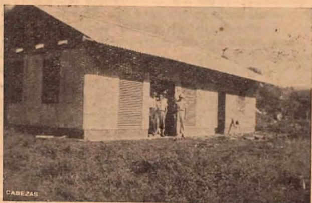
Caseta donde se guardan en Puerto Cortés las dos plantas del servicio de electricidad

Puerto Cortés continuó, no obstante lo dicho, siempre adelante. Tuvo ciertamente sus bajas en cuanto a su desenvolvimiento. Se estacionó un poco. Pero en los últimos años se operó de nuevo una reacción favorable y así vemos cómo la Municipalidad se empeñó en realizar una