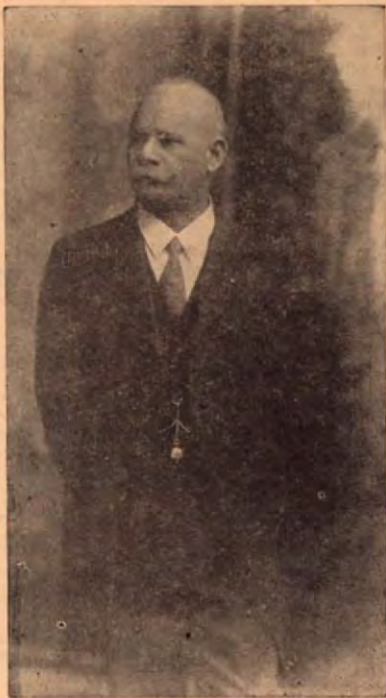
Genl. don J. Santos Zelaya