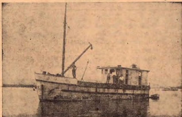
Lancha LA GAVIOTA