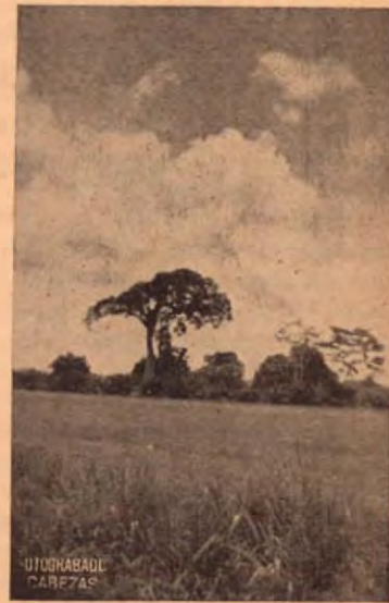
El árbol sagrado de Palmar Sur de la zona bananera, del cual se cuenta una bonita leyenda