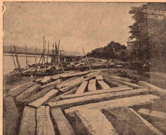
Madera en el puertecito de embarque

Una empresa al servicio del desarrollo industrial de la madera en Costa Rica.