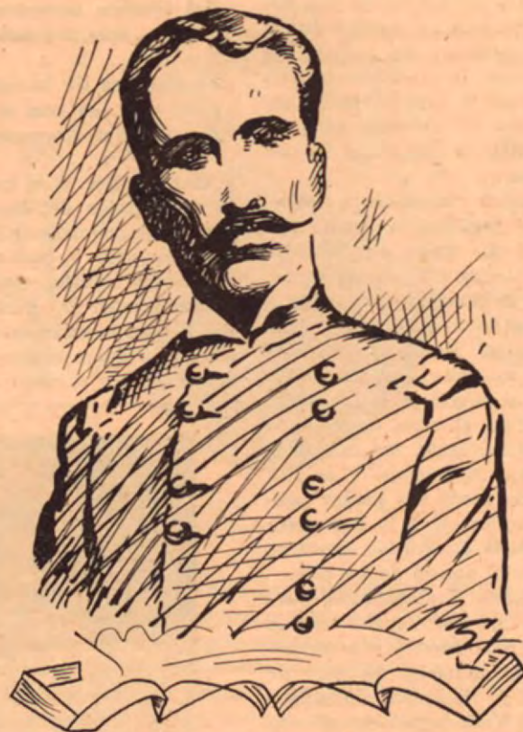
General Cabezas Figueroa que reincorporó la Mosquitia a Nicaragua

La Mosquitia nicaragüense, como la hondureña, estuvo bajo la férula de los ingleses largo tiempo. Recordemos que Peter Wallace, el ocupante de Belice, el territorio que muchos conocen impropriamente como "Honduras Británica", ya merodeaban en las costas del Caribe pertenecientes a Centroamérica desde los inicios del Siglo XVII. Sacando palo de tinte y otras maderas preciosas como la caoba, los piratas y bucaneros aprovechaban también buena parte de su tiempo para depredar las florecientes colonias hispánicas de toda esta porción del hemisferio occidental en aquellos lejanos tiempos.