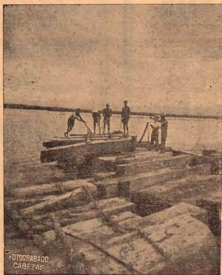
Amarre de la madera en el río.

Nuestras maderas son distribuidas por las casas más serias en el ramo en SAN JOSE, como el