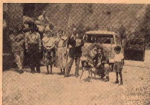
Una pasada en el Cerro de la Muerte Carretera Panamericana

Esta es la verdad y por eso es que COSTA RICA DE AYER Y HOY se complace en acoger el plan de los rotarios, en la seguridad de que él es bien visto por toda la ciudadanía que pugna por una Puntarenas más grande, más bella y más limpia y confortable.