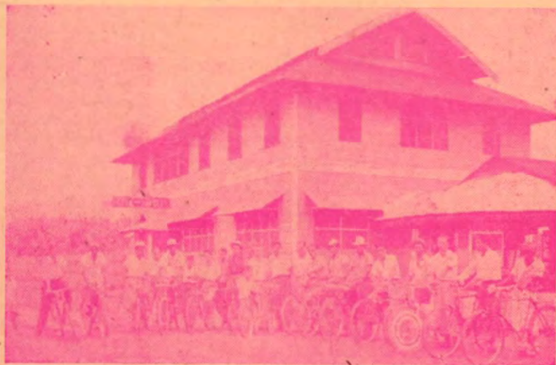
No, no es una manifestación política, sino un grupo de entusiastas ciclistas de la Zona de Pto. Cortés.