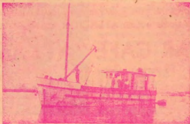
Lancha LA GAVIOTA