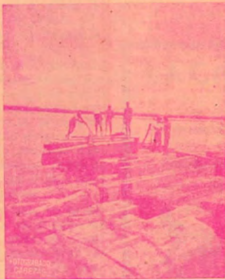
Amarre de la madera en el río.

Nuestras maderas son distribuidas por las casas más serias en el ramo en SAN JOSE, como el,