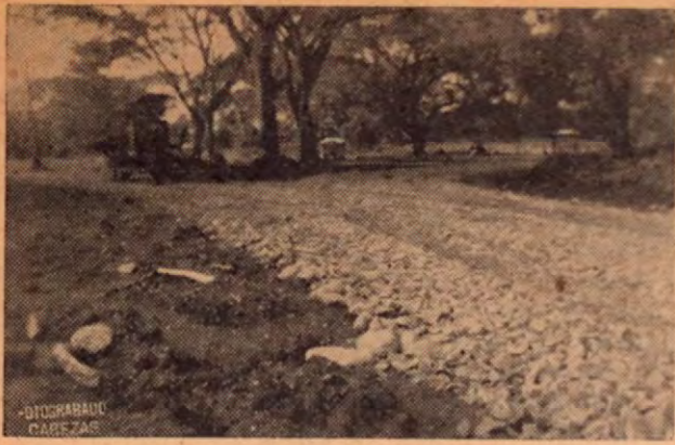
Entronque de la trocha de Las Juntas a la Carretera Panamericana en La Irma