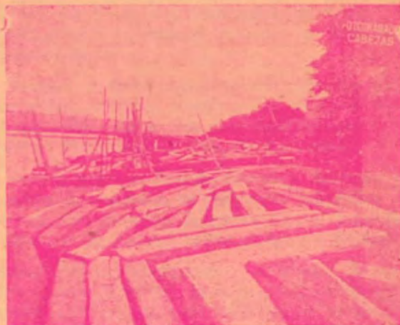
Madera en el puertecito de embarque

Una empresa al servicio del desarrollo industrial de la madera en Costa Rica.