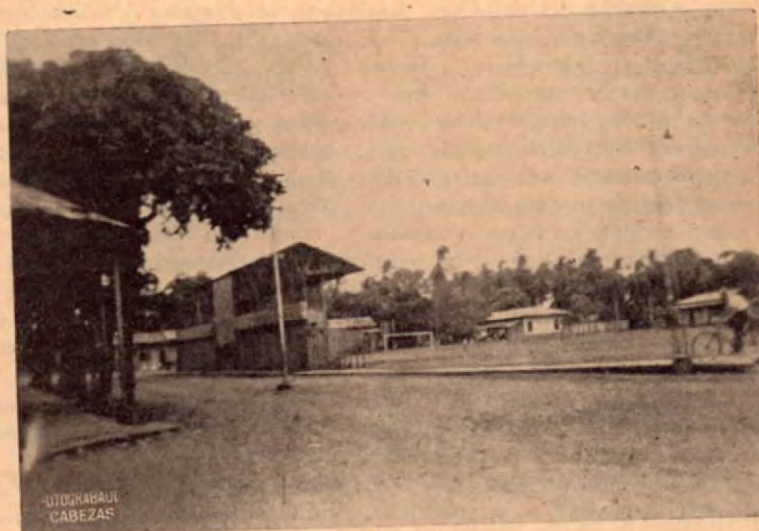
Lo que queda de lo que fuera el Stadium de Puntarenas. ¿No podría intentarse hacer uno nuevo?