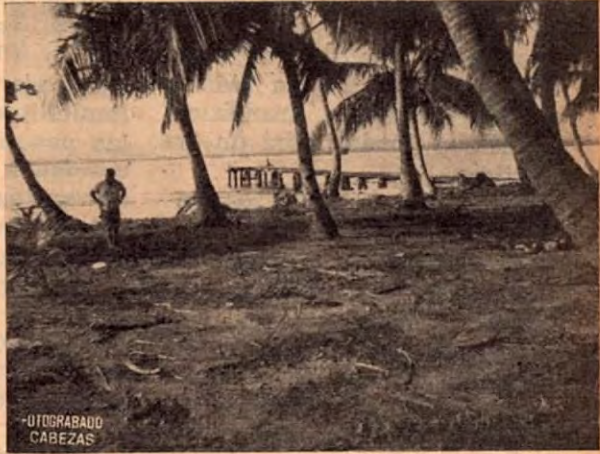
La Uvita punto de atracción turística en la Zona Atlántica.