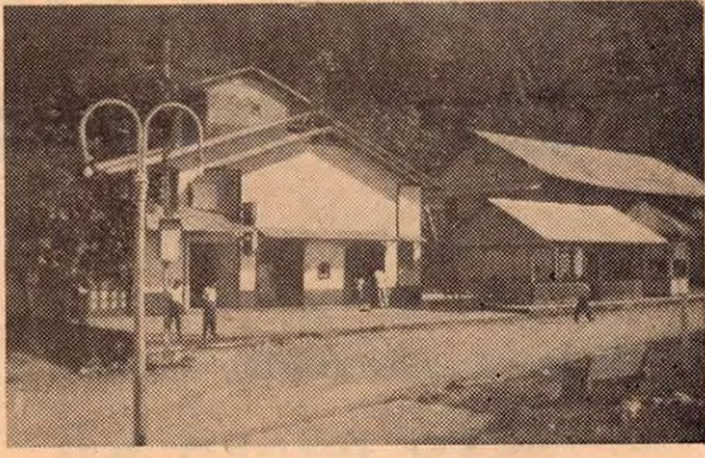
Edificio Cantina y Salón Miramar — Quepos