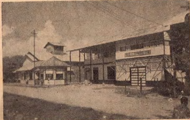
Teatro San Jorge — Quepos

TEATRO SAN JORGE — CANTINA — REFRESQUERIA — SALON DE BAILE — KIOSCO