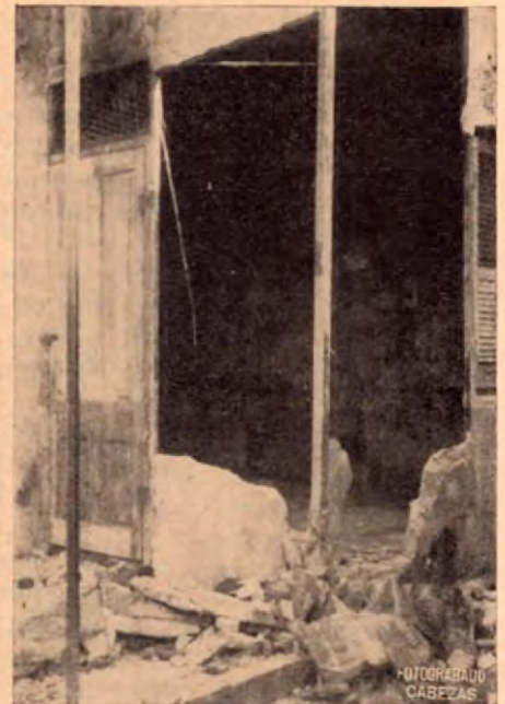
Con la destrucción que ocasionó el terremoto se agravó más el problema de la vivienda en Limón