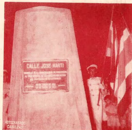
Desvelización del Monumento que contiene la Placa de homenaje a José Martí al bautizarse la Calle 2ª con su nombre, un grupo de alumnos del "Liceo Martí" hace la Guardia de Honor