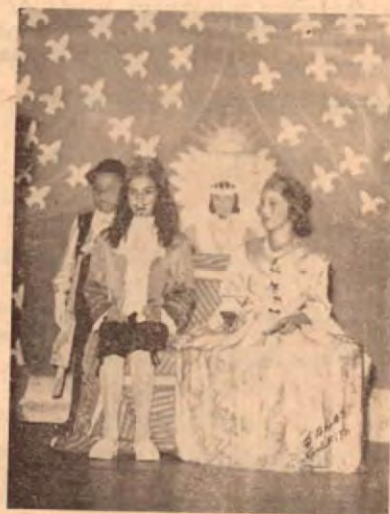
Niños de la Escuela Mixta de Golfito de la Cía. Bananera, hacen papeles de príncipes en la dramatización "El Gato con Botas". Acto Público de 1952