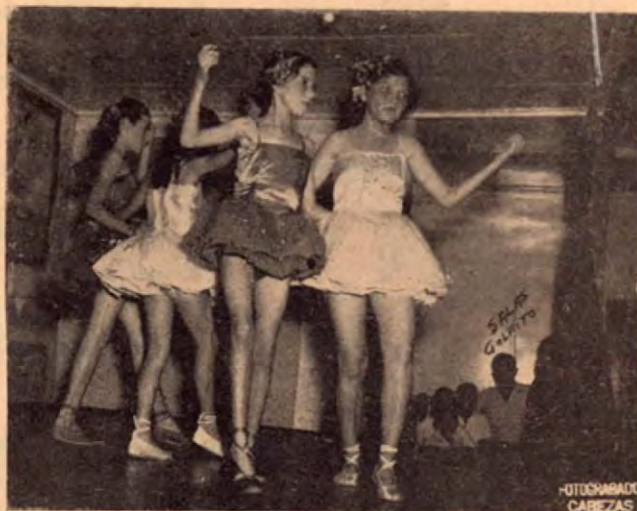
El ballet de la Escuela Mixta de Golfito, de la Compañía Bananera de Costa Rica, Div. de Golfito, ejecutan una danza clásica.—Dic. de 1952. Acto Público

Apartado N° 417 - Puerto Limón, Costa Rica