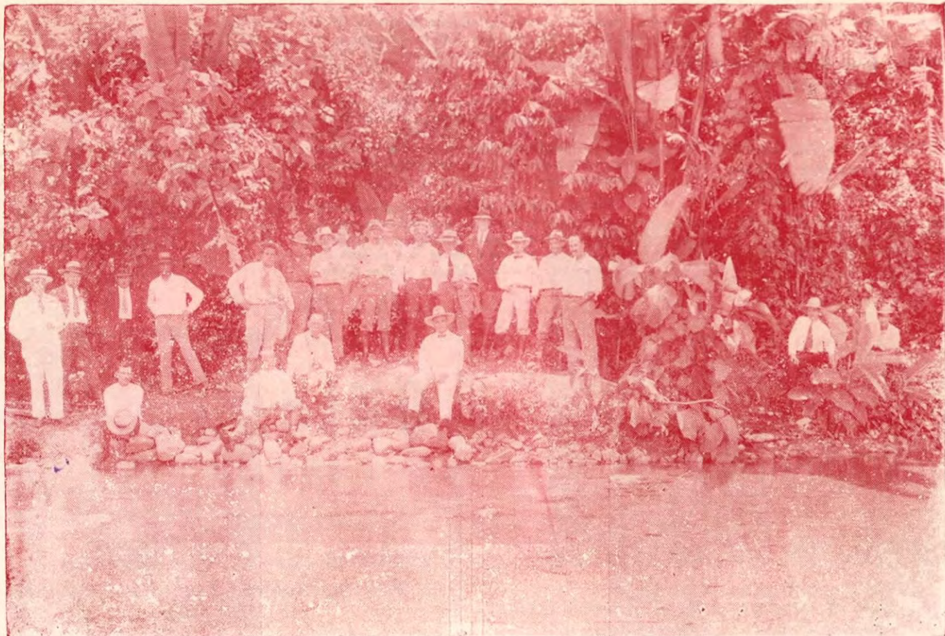
Miembros de la Junta de Pavimentación visitando el tanque de capacitación de la cañería de Limón en 1928, que fué destruído en los grandes temporales de ese mismo año