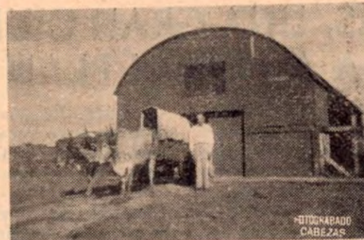
Bodega de granos del Consejo Nacional de Producción