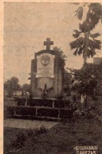
Mausoleo en Cañas, a la par de la iglesia donde descansan los restos mortales de Monseñor Leopold, benefactor de la localidad