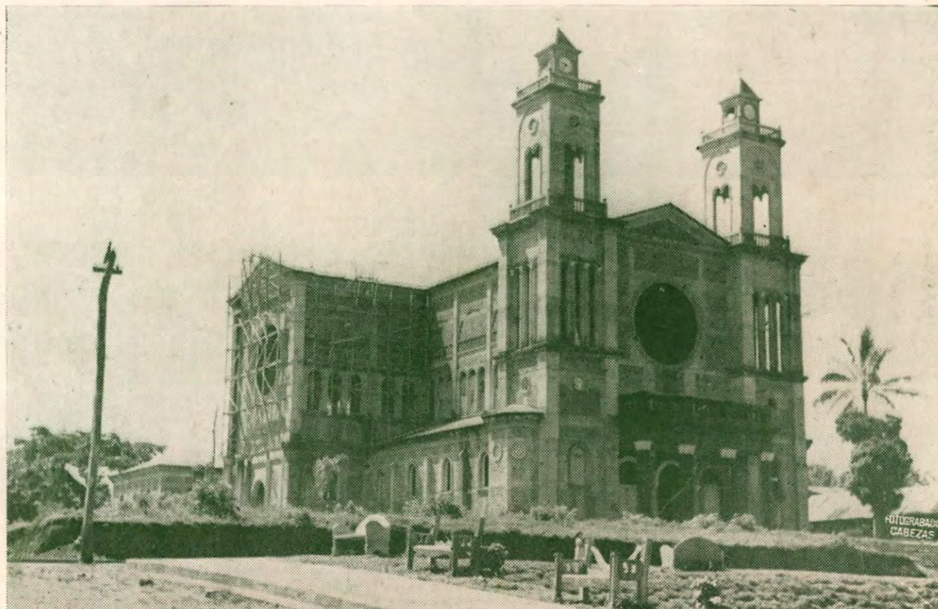
Iglesia de Santiago de Puriscal - Una de las más bonitas del país