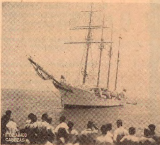
"EL SEBASTIAN ELCANO" EN AGUAS COSTARRICENSES

¡No vengas! En mi vasto desconsuelo, extinguióse la fuerza de mis alas y hasta perdí la vocación del vuelo.