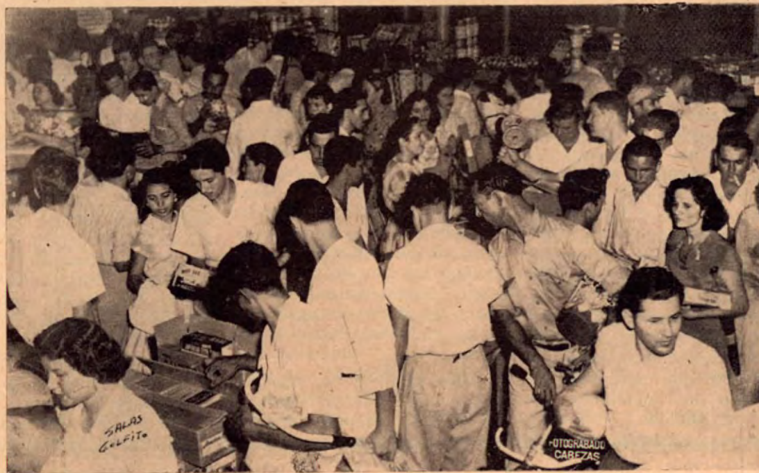
La venta de juguetes de Navidad en el Comisariato de la Cía. Bananera de Golfito

También piensa en un nuevo mercado. El que está en servicio es particular y quieren uno que sea municipal, para lo que pretenden pasar su pequeña iglesia a Rancho Grande y ocupar el sitio para la nueva obra. Esto es más o menos lo que se nos dijo. Bien por Quepos!