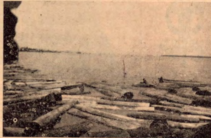
Amarre de la madera en el río.