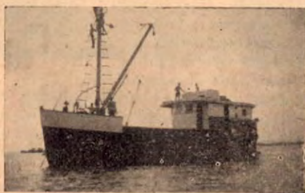
Aspecto de la Gaviota

Para viajes de recreo o pesca deportiva, ofrecemos nuestra lancha