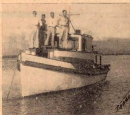
Lancha Santa Teresita

Una Empresa al servicio del desarrollo industrial de la ma- dera en Costa Rica.