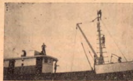
Puente de Mando

Para viajes de recreo o pesca deportiva, ofrecemos nuestra lancha