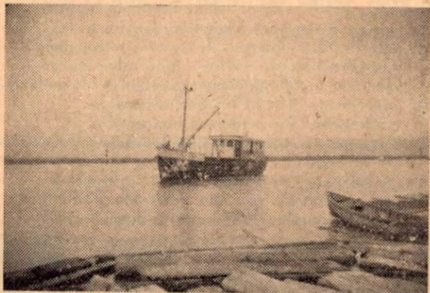
Lancha La Gaviota