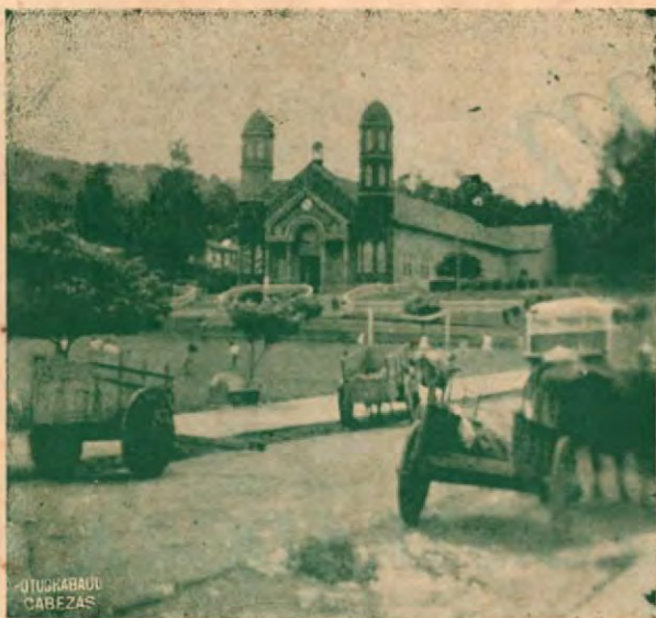
Una preciosa vista panorámica de la Plaza y la Iglesia de Zarcero.