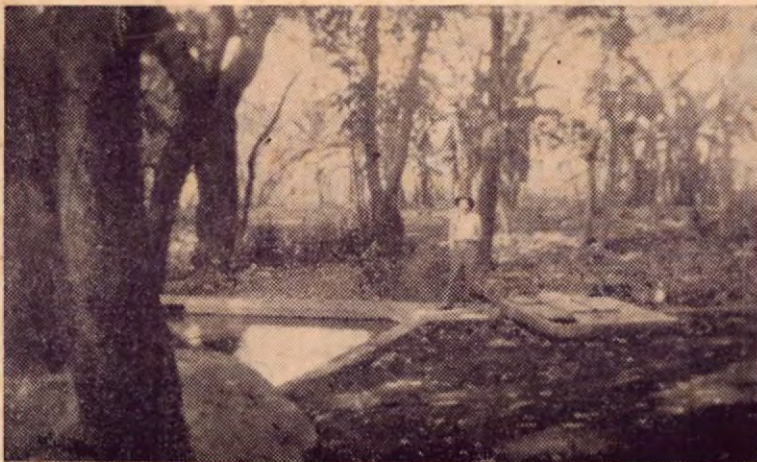
Un aspecto de la fuente donde se recoge el agua de la nueva cañería de Bagaces, recientemente inaugurada por el señor Pdte. Ulate.