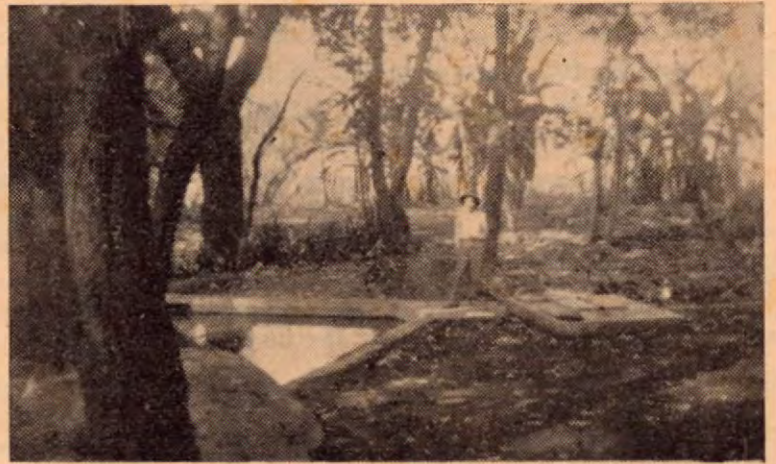
Un aspecto de la fuente donde se recoge el agua de la nueva cañería en Bagaces