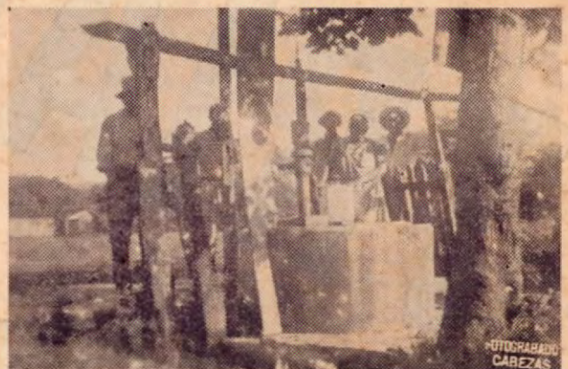
En cambio en Santa Bárbara de Santa Cruz de Guanacaste, todavía la población se surte de agua potable de un pozo público completamente insalubre.