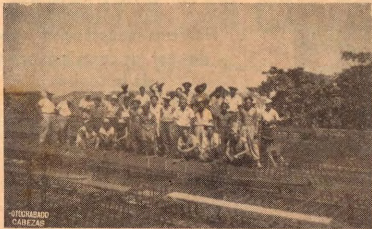
Grupo de trabajadores de la construcción

Pronto contará la ciudad de Puntarenas con su nueva escuela ANTONIO GAMEZ, adonde llevar el excedente de población escolar, que por la falta de ese edificio, constituía un problema educacional muy serio.