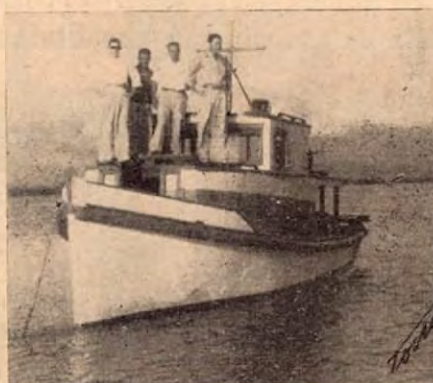
Lancha Santa Teresita

Una Empresa al servicio del desarrollo industrial de la ma- dera en Costa Rica.