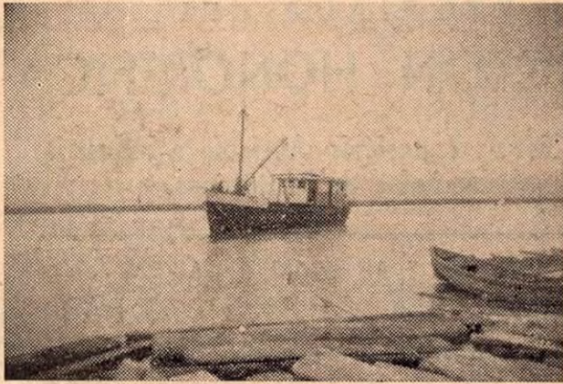
Lancha La Gaviota