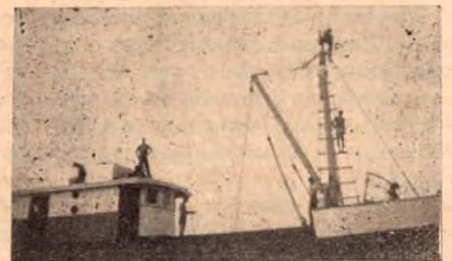
Puente de Mando

Una Empresa al servicio del desarrollo industrial de la ma- dera en Costa Rica.