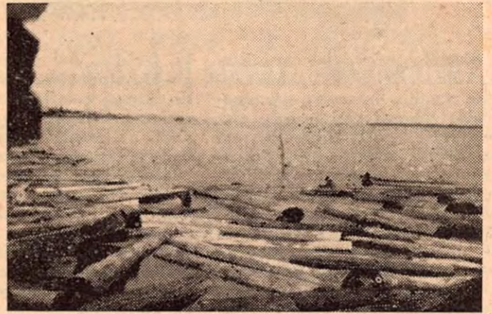
Amarre de la madera en el río.