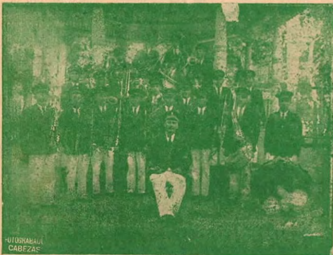
(Fotos tomadas en el Parque Victoria y en el viejo kiosco, por el fotógrafo don Hernán Román).