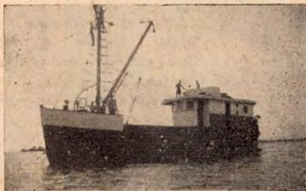
Aspecto de la Gaviota

Para viajes de recreo o pesca deportiva, ofrecemos nuestra lancha