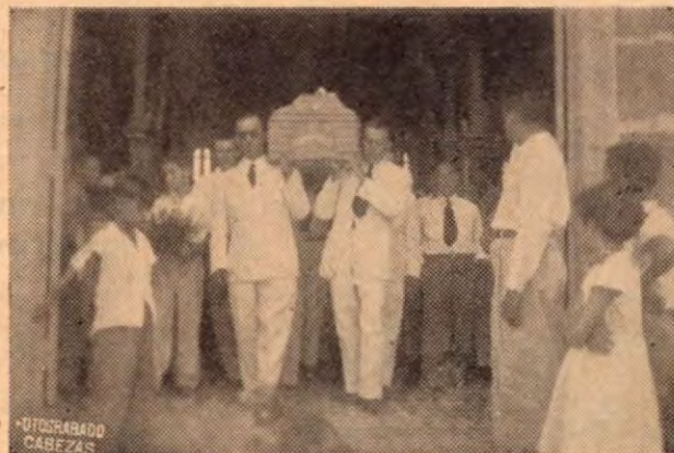
El cortejo sale de la Iglesia

Pronto contará la ciudad de Puntarenas con su nueva escuela ANTONIO GAMEZ, adonde llevar el excedente de población escolar, que por la falta de ese edificio, constituía un problema educacional muy serio.