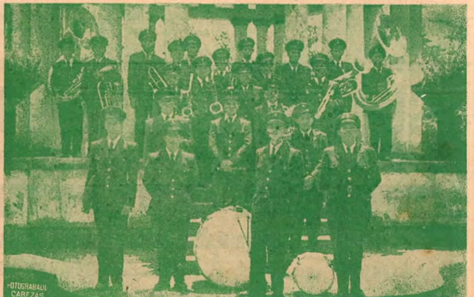
Integrantes de la actual Banda Municipal de Turrialba