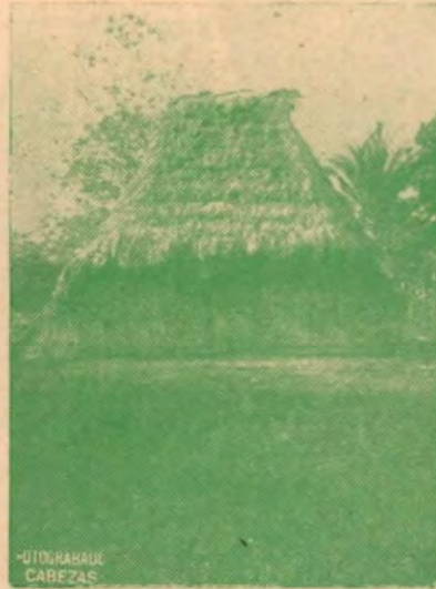
Palenque en Puerto Jiménez