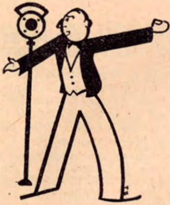
Por Micrófono *

A partir de esta edición de Costa Rica de Ayer y Hoy , iniciaremos esta columna con informaciones de la radiodifusión nacional e internacional. Nos anima el deseo de cooperar desde estas humildes líneas en favor del arte radiofónico en lo que a locutores, artistas, técnica y buena dirección o reglamentación de la misma se refiere...Será, pues, esta una columna que luchará por nuestra superación radiofónica. No dejaremos de ofrecer también algunas noticias de la radio de países como los Estados Unidos, Cuba, Méjico, Panamá, Argentina, Colombia, etc. etc., en donde la radiodifusión se encuentra en pleno apogeo con programas vivos, buenos departamentos de producción y cuadros de locutores especializados en este difícil arte.