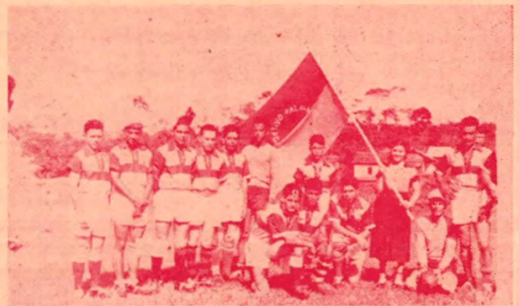
El Distrito de Palmare, también cuenta con su equipo de futbol. Helo aquí posando para esta Revista. ¿Obtendrán el Campeonato?