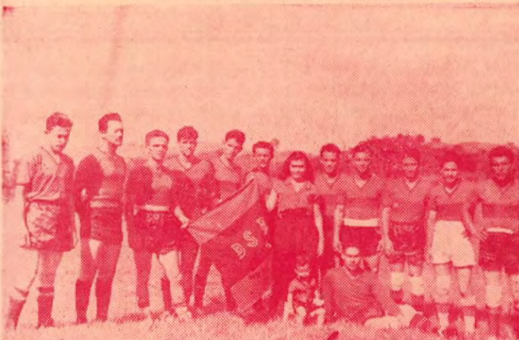
Deportivo "SAN BOSCO", es un equipo de mucho coraje

Como un homenaje al pueblo de San Isidro del General, hemos pergeñado estos sencillos apuntes históricos, que no tienen otra intención que la de compensar, aunque sea en forma tan modesta, la favorable acogida que en este pueblo tiene COSTA RICA DE AYER Y HOY .