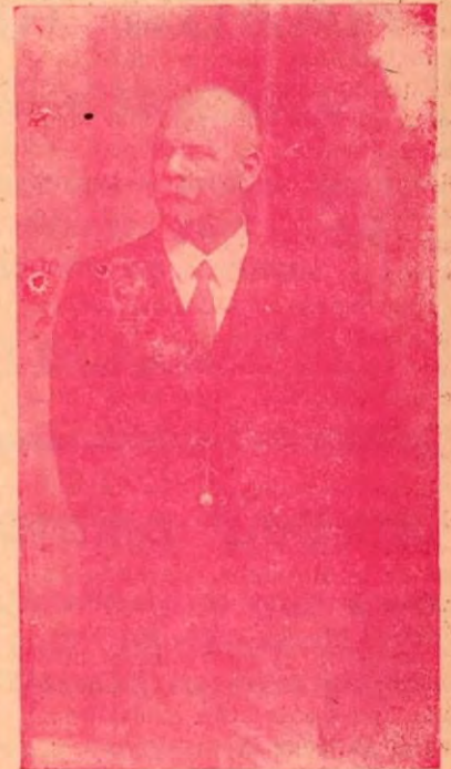
Ex-Presidente General José Santos Zelaya de Nicaragua, que asumió la responsabilidad histórica de la reincorporación mosquitia, apoyando el hecho militar de Cabezas.