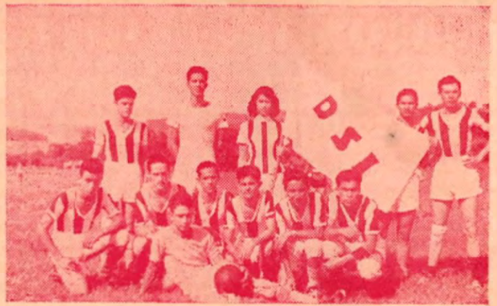
"Deportivo San Isidro".—Su actuación ha sido de mucho brío en este Campeonato Intercantonal que se lleva a cabo en la ciudad de San Isidro.

Hizo estudios en la escuela de su pueblo (primaria). Estudió después en San José y realizó estudios por correspondencia con las Escuelas Internacionales. Actualmente es miembro de la Directiva del Dep. Jeremías Garbanzo y milita en las filas de ese Club Deportivo. Juega además con el Dep. J. O. C. Campeón Relámpago de San Isidro de El General.