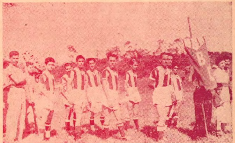
Deportivo "El Banco", cuyo juego movido es de mucho nervio. Su actuación ha sido muy testacada.