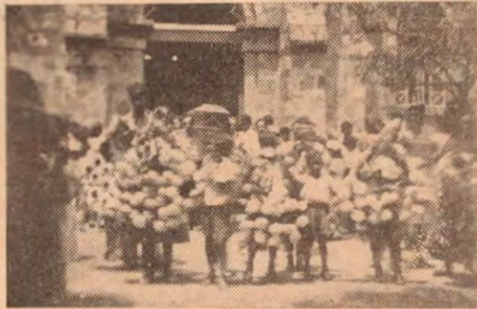
El cortejo fúnebre sale de la iglesia