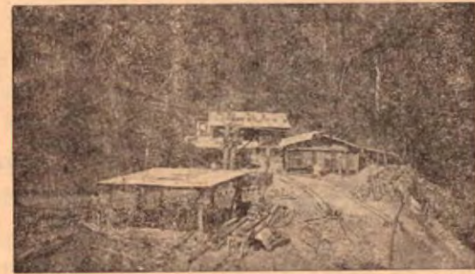
Antiguo nivel del túnel de Los Chanchos en el Mineral de Abangares.