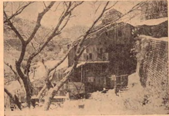
Pabellones de los Mazos en las Minas de Abangares. La Sierra