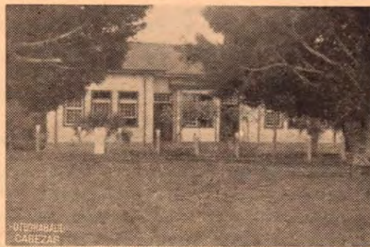
Escuela Rafael Yglesias de Bagaces, Guanacaste