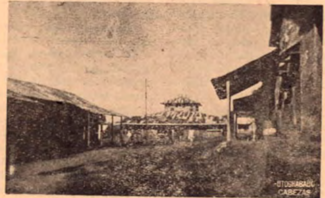
Una calle en Miramar, al fondo el mercado en ruinas