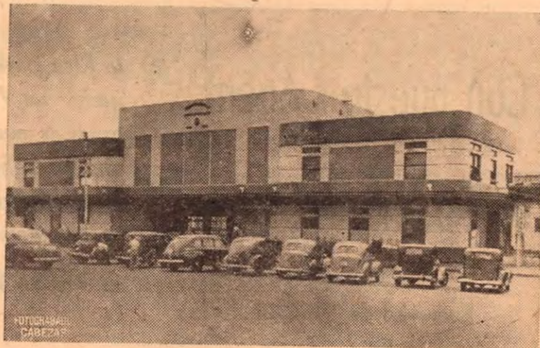
Estación del Ferrocarril Eléctrico al Pacífico San José