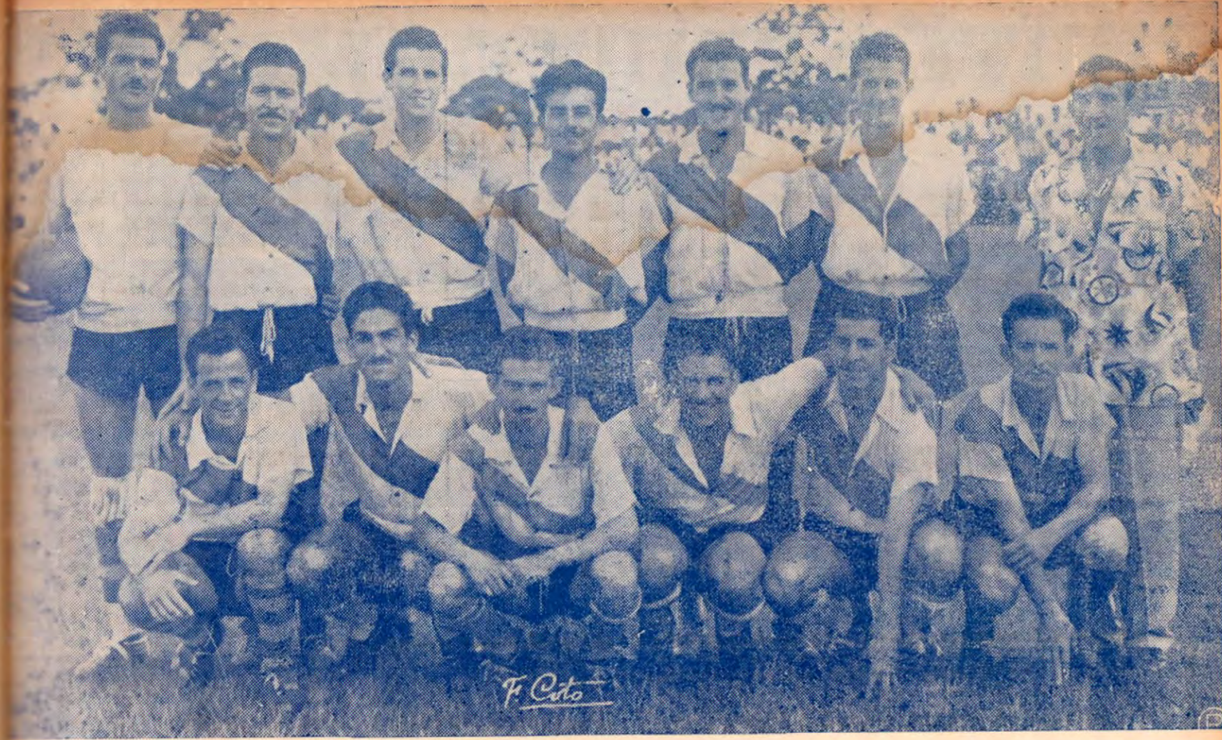
REDIANO Y SAPRISSA, LOS DOS FORMIDABLES CUADROS QUE ENGABEZAN EL CAMPEONATO ACTUAL