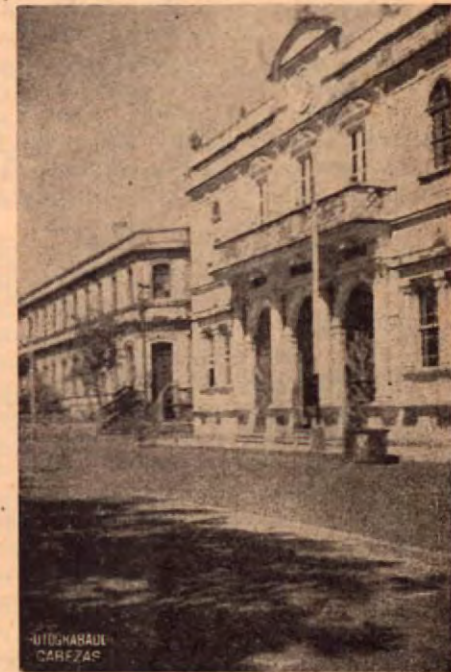
Edificio de la Gobernación Telegráfo y Correo. Al fondo la "Escuela República Argentina"

En todos estos documentos se respeta la ortografía original.