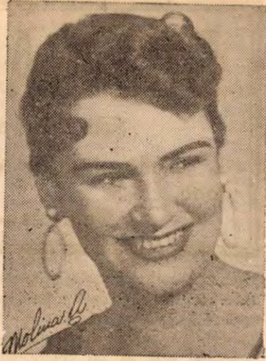
EDELWEISS DALL'ANESE B.