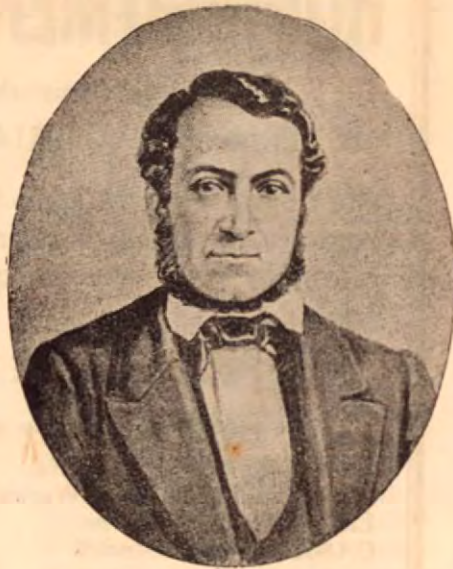
DON JUAN RAFAEL MORA