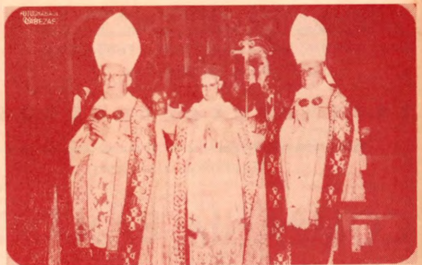
Una instantánea de Monseñor Odio al ser elevado al cargo de Arzobispo de la Diócesis de Costa Rica.

Excelentísimo Monseñor Odio parte hacia Roma