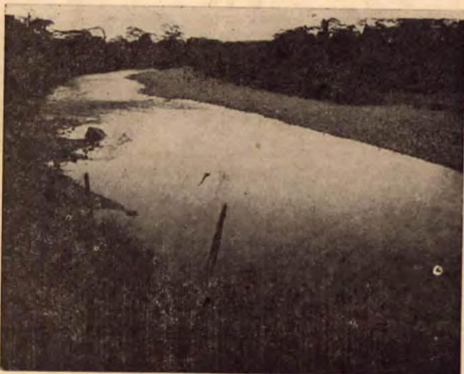
Una preciosa perspectiva del río Estrella en la región Atlántica.

El movimiento está en su período de organización; apenas estamos for mando los Comités en las cabece ras de cantones. El Comité Central funcionará en Puntarenas, pues los puntarenenses esperamos elevar nuestra cuota, cuando se llegue el momento, al máximum de la más alta que se haya aportado en toda la cruzada. PUNTARENAS sostiene casi esta revista con sus anuncios y su venta y esto nos hace optimistas para lo futuro.