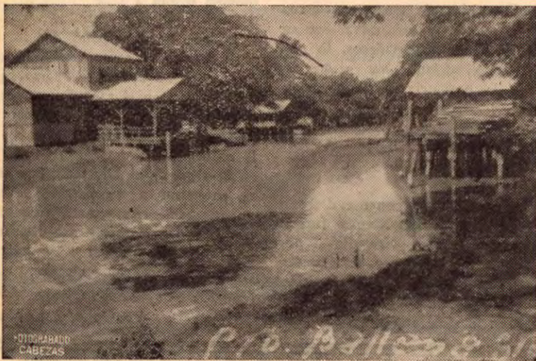
Puertecito de Ballena - Bo'són, Guanacaste