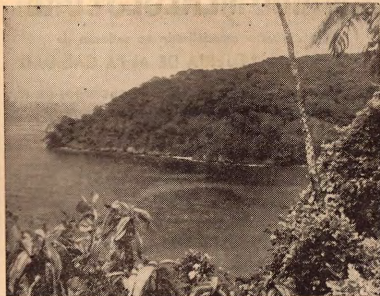
BAHIA DE CHATHAN

La Bahía de Chathan es el único lugar de la isla del Coco en donde los barcos pueden anclar, porque cuenta con la debida protección natural contra los elementos.