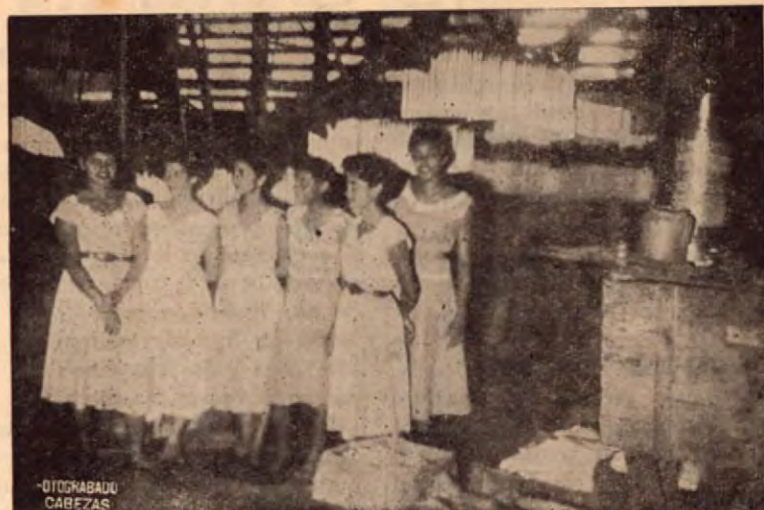
Un aspecto del interior de la fábrica en la sección de candelaría