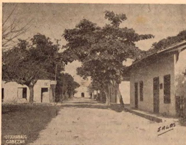
Una calle de la Ciudad de Liberia