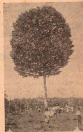
El coposo árbol que era una reliquia en San Isidro de El General y que no debió cortarse

Le envío el trabajo, y con él la fotografía del bellissimo árbol en mención. Por su sencillez, tal vez guste el trabajito. Aquí estoy seguro que gustará. Espero verlo en el próximo número de C. R. de Ayer y Hoy.