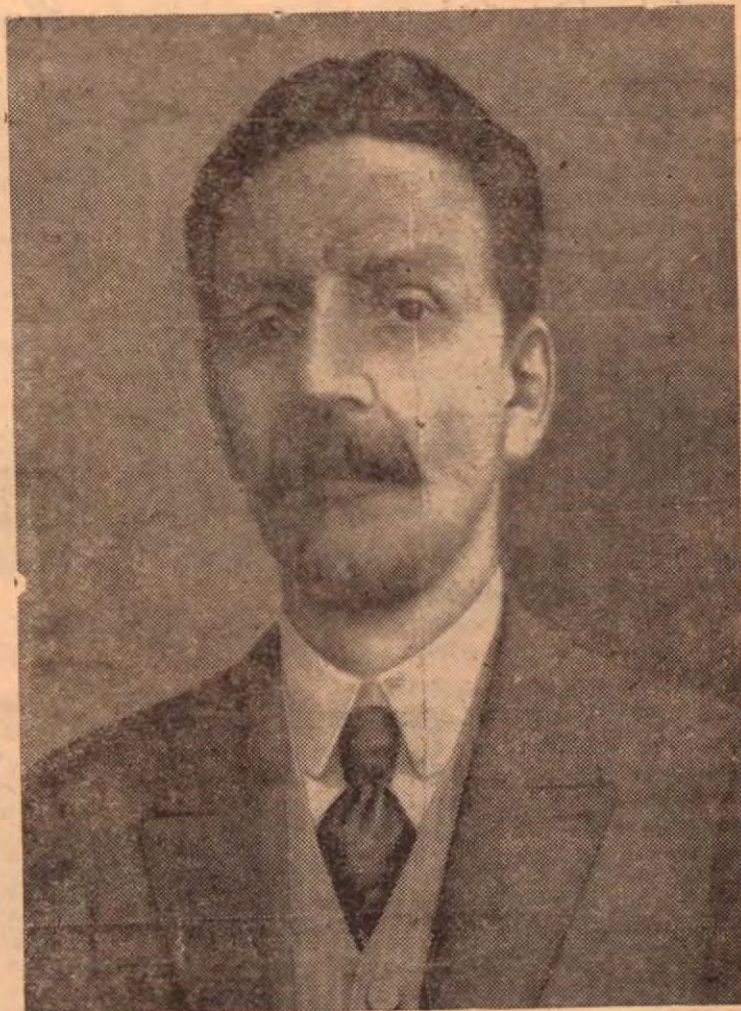
Periodista e historiador