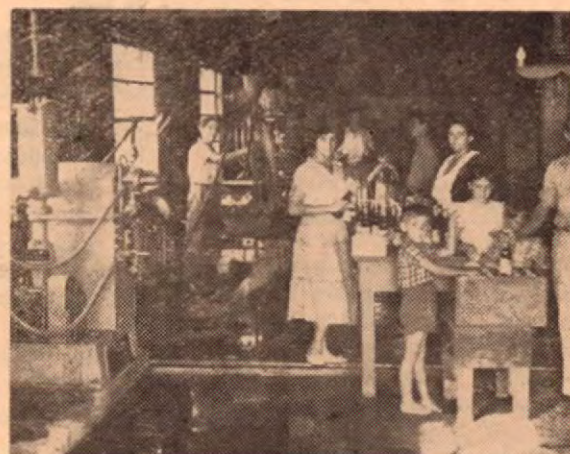
Interior de la fábrica