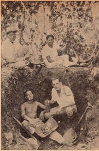
Sacando huacas o entierros de indios en Nicoya, Gte.

En el Museo de San José hay unas grandes losas, un poco cón-