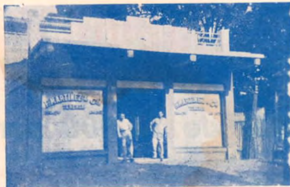
Moderno edificio donde se encuentran instala- dos el expendio y la talabartería.

Sin duda alguna que Ud. necesitará comprar una ba- lija, un maletín o una cartera de viajar, recuerde enton- ces que nadie está en mejores condiciones de servirlo y dejarlo satisfecho completamente que,