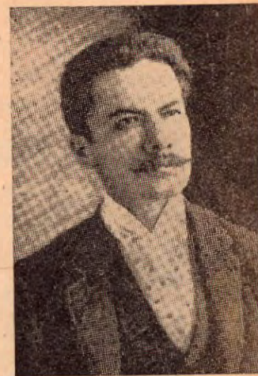
Rubén Darío cuando en 1891 vino a Costa Rica

Yo soy el ánfora del celeste perfume: tengo el amor. Paloma, estrella, nido lirio, vosotros conocéis mi morada. Para los vuelos incommensurables tengo alas de águila que parten a golpes mágicos el huracán. Y para hallar consonantes, las busco en dos bocas que se juntan; y estalla el beso, y escribo la estrofa, y entonces, si véis mi alma, conoceréis a mi musa. Amo las epopeyas, porque de ellas brota el soplo heroico que agita las banderas que ondean sobre las lanzas y los penachos que tiemblan sobre los cascos; los cantos líricos, porque hablan de las diosas y de los amores; y las églogas, porque son olorosas a verbena y a tomillo, y el santo aliento del buey coronado de rosas. Yo escribiría algo inmortal; más me abruma un porvenir de miseria y de hambre.