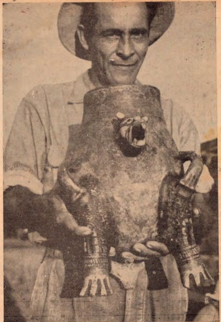
Los recios temporales y la inundación del río Tempisque del año pasado en Filadelfia dejaron al descubierto algunos entierros.

Armas de guerra son raras, indicando que los indios eran pacíficos. Comúnmente se encuentra uno, dos o tres artículos en cada tumba — en algunos no se encuentra nada. Mientras que las tumbas de caciques y altos personajes indios contienen un rico botín. Las vasijas corrientes que se encuentran son de barro cocido que usaban los indios para cocinar, para llevar agua, para almacenar alimentos y para hacer la chicha. Algunas de las vasijas son poligráficas muy interesantes porque contienen dibujos convencionales de formas animales y humanas, así como formas simbólicas que hasta la hora no se han decifrado.