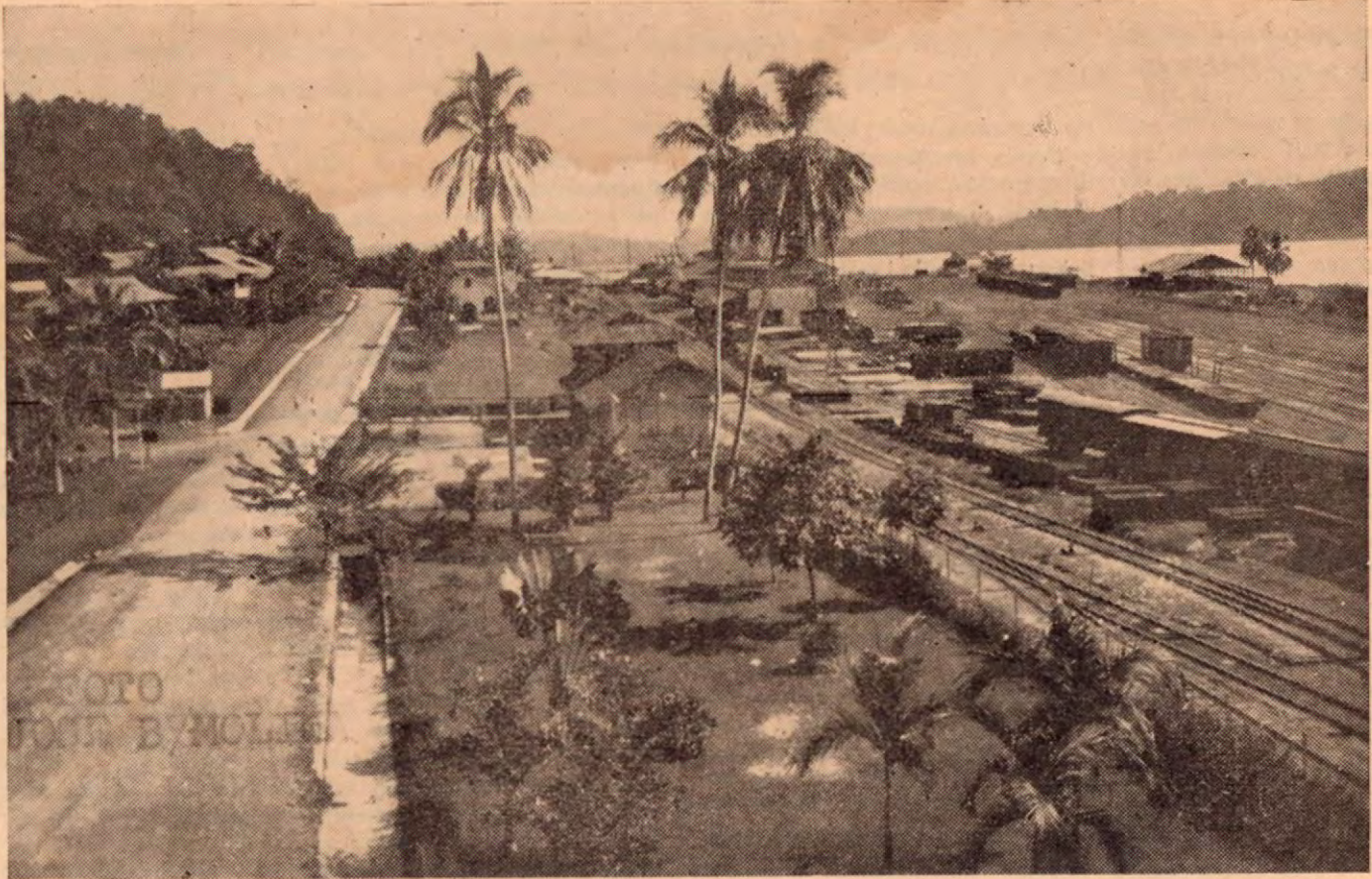
Un aspecto panorámico de Golfito. — Al fondo se divisa parte de la bahía.

las aguas de lluvia y los albañales. No existe edificio alguno en su interior, por lo que no se causa perjuicios a la Compañía.