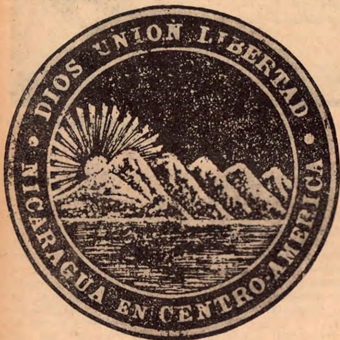
El gran sello de la república, que Walker usaba como Presidente de Nicaragua.

(Continuará en nuestra próxima edición).