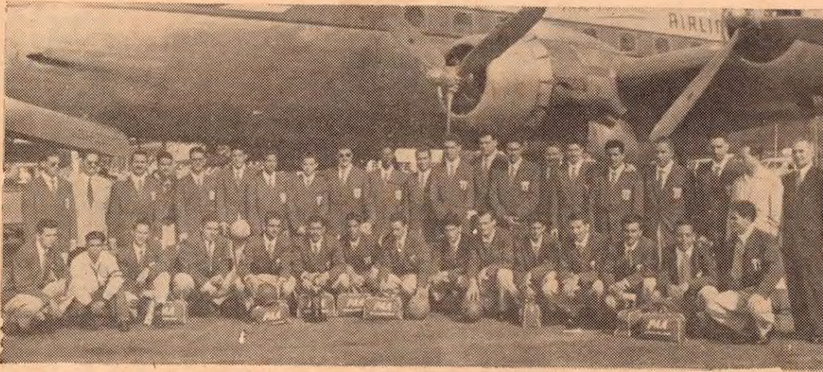
★ La Selección Nacional a su salida para las competencias de fútbol en Honduras. ★