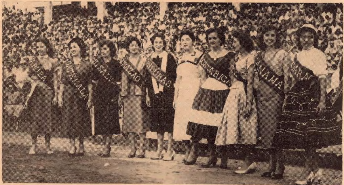
Con sumo placer traemos a nuestras páginas la belleza encantadora de las simpáticas madrinas del reciente torneo futbolístico celebrado en la hermana república de Honduras. Para damitas tan distinguidas, que tanto realce le dieran a esas justas deportivas, el saludo afectuoso de esta revista.