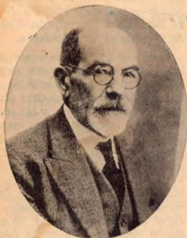
Una de las últimas fotografías de Don Cleto González Víquez

Fuera trabajo inaudito el de señalar una por una las obras de don Cleto concernientes al Bien Público; y en verdad, tarea inútil si la labor del Presidente Municipal de San José, y luego de la República, tuviera que limitarse a un inventario escueto y sin vida de aceras y alcantarillas, parques y cañerías, desparramados tanto en el recinto de esta capital cuanto en la mayoría de las poblaciones del país.