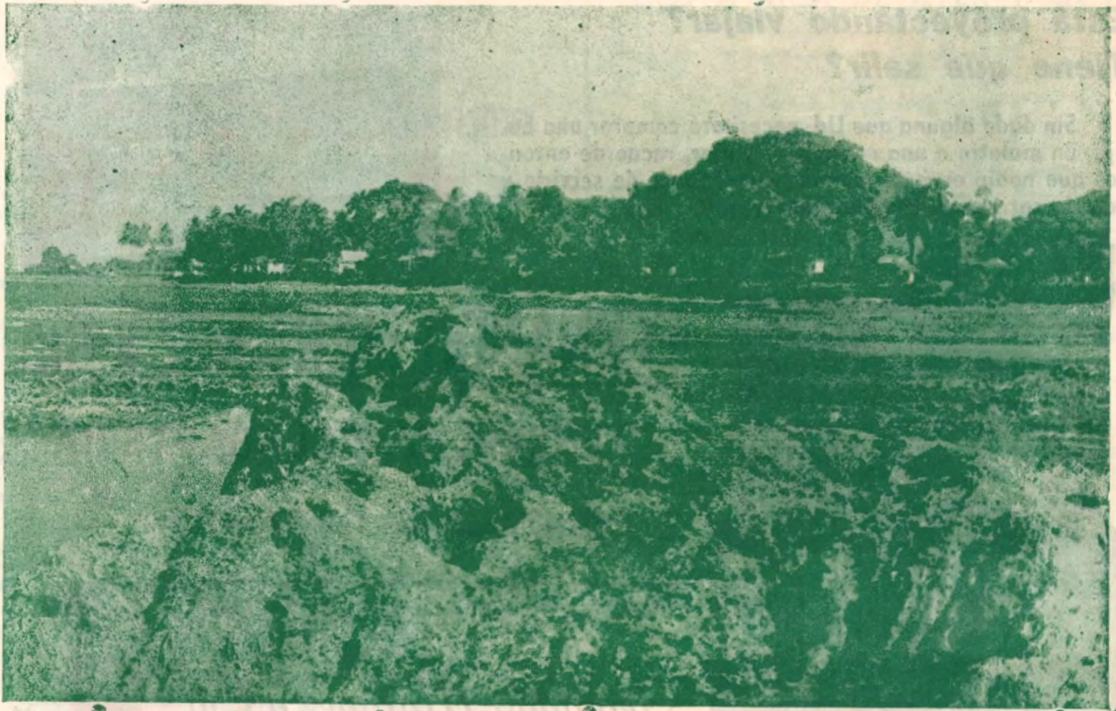
Vista panorámica de la "Zona Americana" de Limón, contemplada desde un arrefice del frente, en una entrada de mar en la costa.