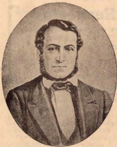
DON JUAN RAFAEL M

A través de la figura procerca de don Juan Rafael Mora, los costarricenses han admirado su gesta de la guerra contra los filibusteros, pero la mayor parte de nuestros connacionales desconocen al hombre y al gobernante. Bajo la impresión de esta premisa, es que estamos trayendo a estas páginas de "COSTA RICA DE AYER Y HOY" la recopilación histórica de sus efemerides más sobresalientes.