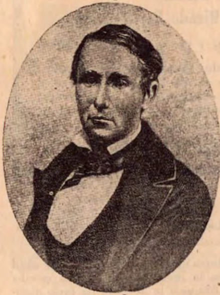
El Jefe de los Filibusteros.

Compatriotas nuestros habían comenzado a radicarse por allá. Era la gran vía entre el Atlántico y el Pacífico. La nueva ruta del tránsito entre Nueva York y Nueva Orleans y San Fco. La avenida del futuro entre Europa y el Oriente. Allí se encontraba oro y plata en las montañas; piedras preciosas en los ríos y perlas en las costas; la tierra era exuberante; todo producto tropical se encontraba en abundancia. La único que se requería allí era orden, seguridad y estabilidad en el Gobierno.