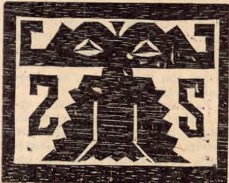
Decoración de un lagarto en un tambor de madera. Cultura Güetar. Colec. Retes