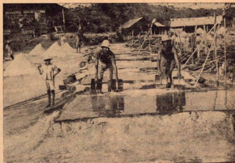
Serie de pailas de cocer el agua salada cuando ya está de punto.