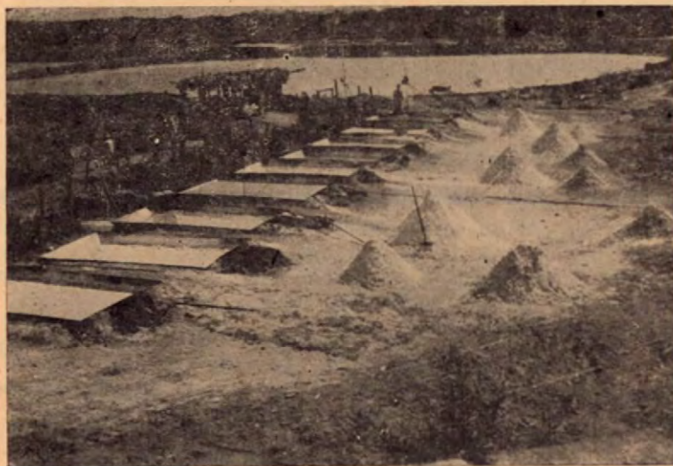
Pailas secadoras de sal.