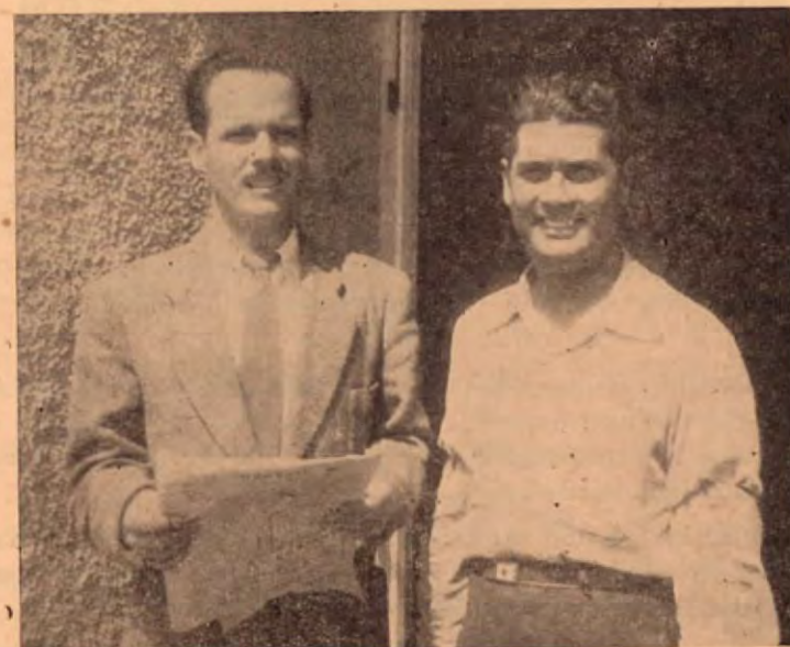
Presidente y Secretario de la Prensa pequeña de Costa Rica

Recientemente a quedado fundada la asociación de periodistas, directores de revistas y semanarios nacionales en la ciudad de San José.