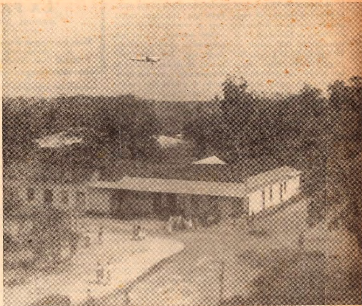
UN ASPECTO INTERESANTE Y PINTORESCO DE LA CIUDAD DE LIBERIA

Al regreso, en uno de los andenes iba explicando los alcances de la obra y su valor en la economía nacional, y para concluir, les rogaba que accedieran a tramitar pronto el pago