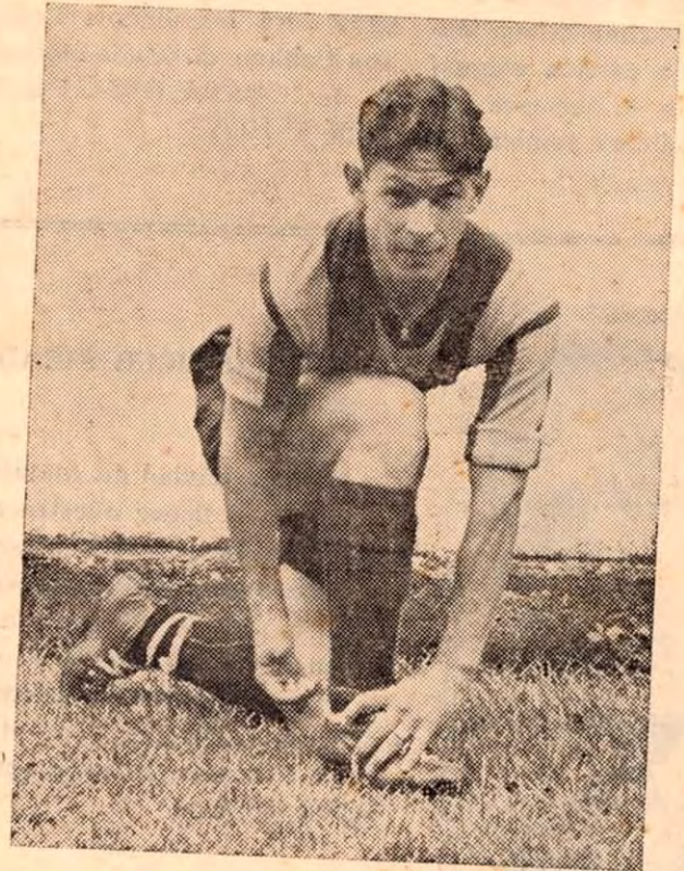
ALEJANDRO MORERA S.

Uno de los más grandes futbolistas de Costa Rica