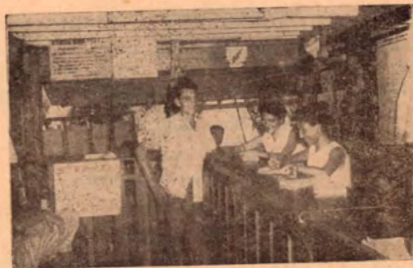
Oficina de LACSA en Golfito

LACSA, la más vieja y con más experiencia empresa de aviación nacional, se complace en comunicarles que su nuevo ITINERARIO ha sido ampliado a más vuelos por semana, a fin de ayudar al desenvolvimiento progresista de Golfito y toda la Zona Bananera.