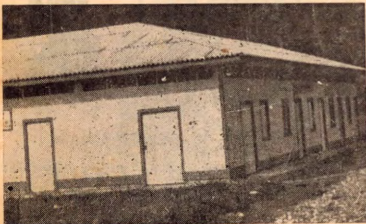
La gráfica recoge un aspecto del edificio en donde se halla instalada la Agencia del Banco Nacional de Costa Rica en Villa Neily.

NOTA: El anterior relato lo entresacamos de "Reseña Histórica de Talamanca", el notable libro del ilustre benemérito de la Patria, y recordado literato e historiador, don Ricardo Fernández Guardia, :