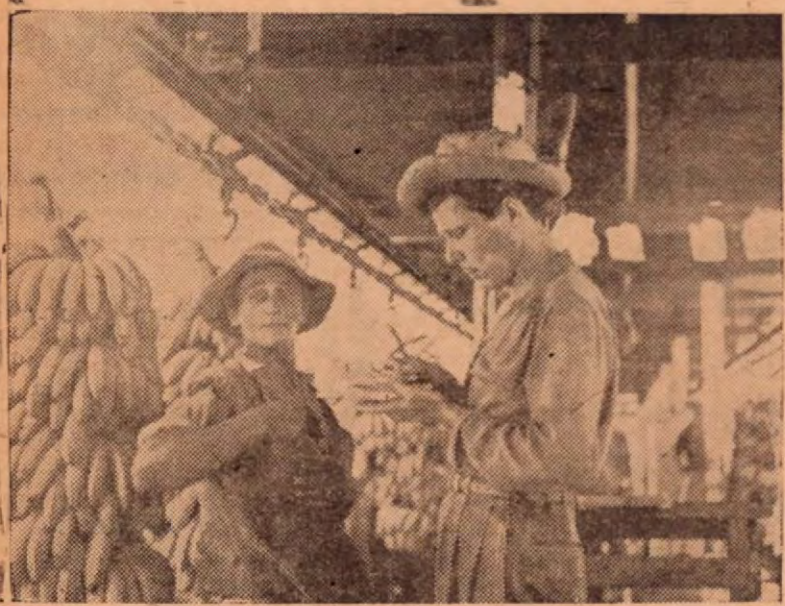
GOLFITO: GRAN CENTRO DE EXPORTACION