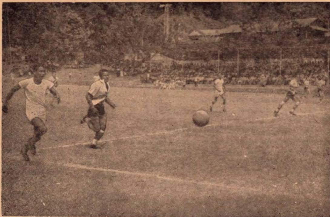
Golfito fue la primera población del país que tuvo Estadio para jugar futbol y basquet de noche