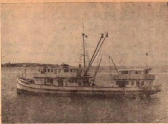
La Motonave "DON FABIO" en la bella y panorámica rada del Puerto de Golfito