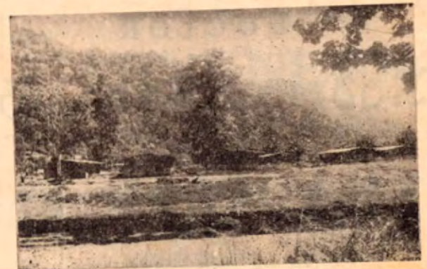
Pabellones casi terminados del Colegio Vocacional y viviendas alegres y confortables que el INVU está construyendo para los profesores.