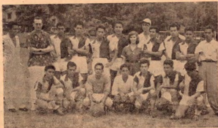
DEP. GOLFITEÑO, otro de los pioneros del futbol de Golfito