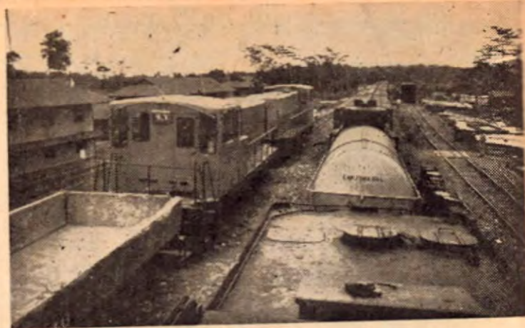
Una perspectiva de un tren de los Ferrocarriles del Sur. Largas hileras de decenas de carros transportando fruta, se abren paso sobre la paralela de acero, entre plantaciones y selvas en la tropicalísima región de Golfito, la tierra de la promisión.

CUANDO ESCRIBA A NUESTROS ANUNCIADOS, LE ROGAMOS MUY ATENTAMENTE QUE SEA MUY SERVIDO MENCIONAR ESTA REVISTA. —