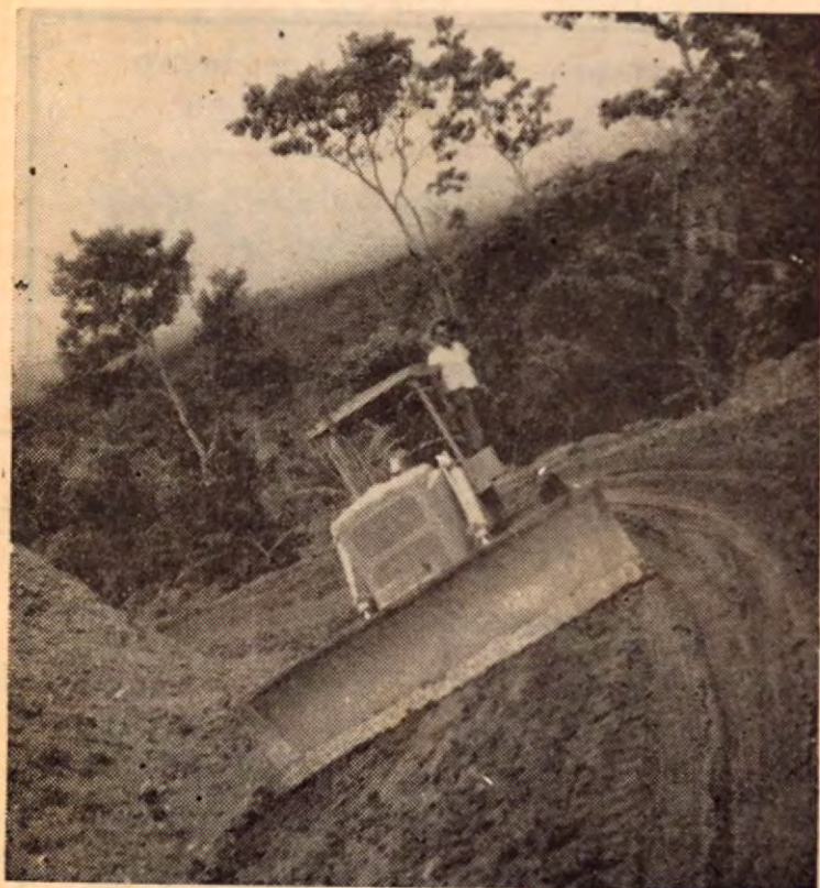
Abriendo brecha con los tractores, para la Carretera Interamericana en Golfito

Para tan dignos caballeros y excelentes funcionarios, nuestro afectuoso saludo.