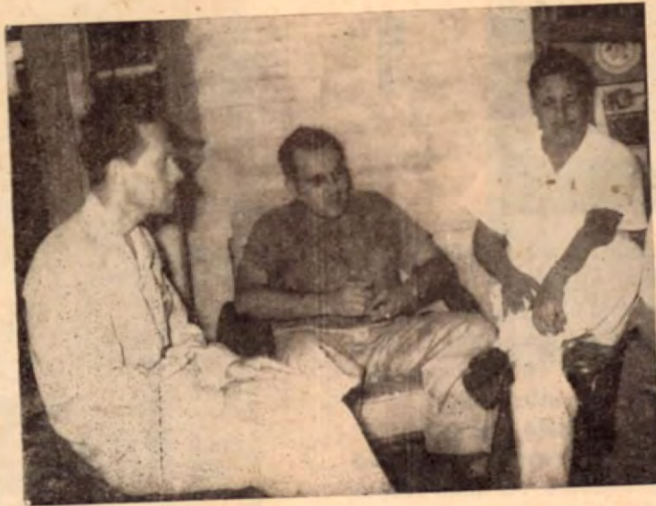
Junta Administradora del Colegio Vocacional

El curso corriente o académico será de cinco años, pero para comenzar abriremos los estudios hasta el tercer año. Además se contará con siete talleres y más adelante, cuando esté listo el Colegio, se contará con campo de juegos, piscinas, canchas de fútbol, basquet y tenis, y un salón de actos o auditorium.