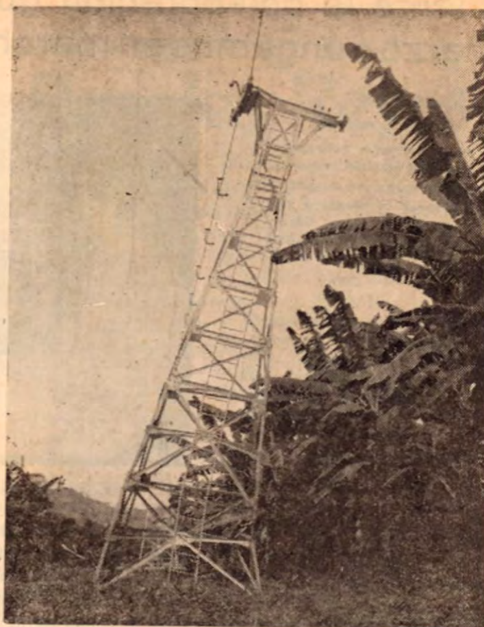
Andariveles para el traslado aéreo del banano, sobre el Térraba