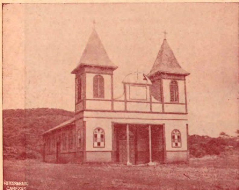
ERMITA DE SANTIAGO DE PALMARES