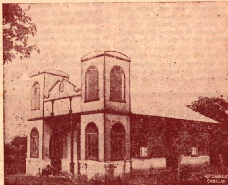
La preciosa Ermita de Candelaria de Palmares