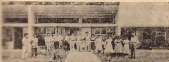
BIBLIOTECA PUBLICA DE PALMARES