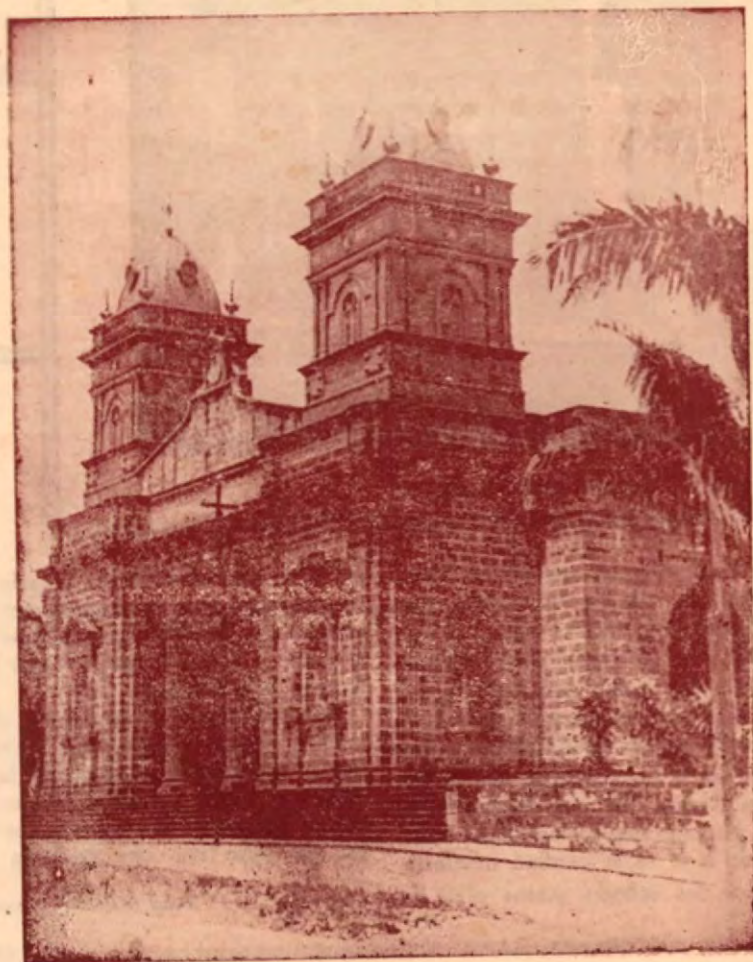
El Templo Católico de Palmares