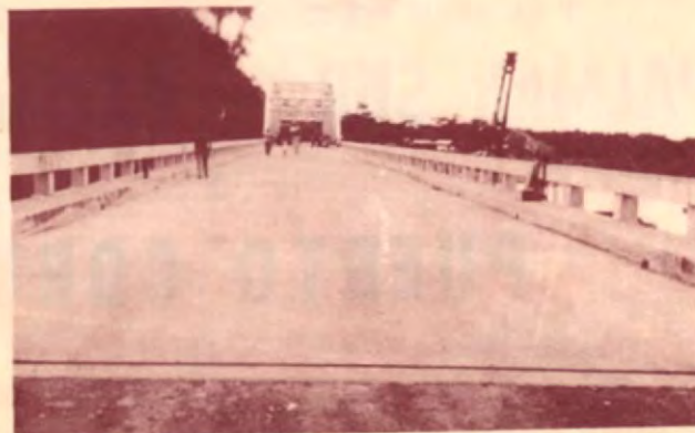
PUENTE DEL RIO TERRABA