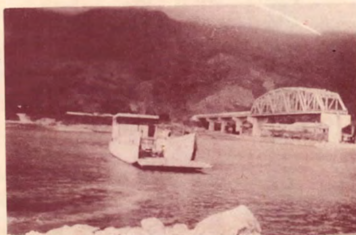
Diferentes etapas en la construcción del Puente sobre el río Terraba.