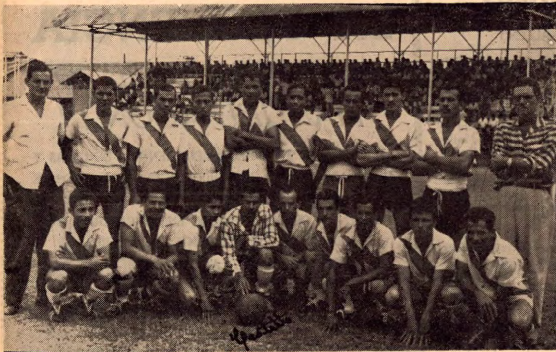
Posando para esta revista el conjunto de Finca 9 de Palmar, minutos antes de escenificar cotejo de fútbol con el Ferrocarril F. C. de Golfito, en disputa del título de "Campeón de Campeones". La fotografía fue tomada en el campo de deportes de Palmar, el 22 de mayo pasado, al inaugurarse el torneo.

EL CORAJUDO CONJUNTO DE FINCA 9 DE PALMAR NORTE DE OSA