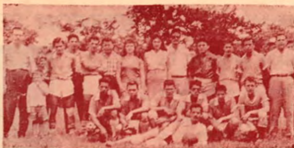
EQUIPO DEPORTIVO PALMARES

es sencillamente maravilloso; y futbolísticamente hablando creo que ya es una potencia.