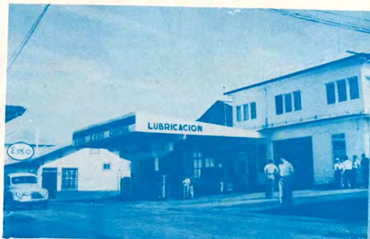
EL OASIS DE LOS AUTOMOVILISTAS

GASOLINA — ACEITE DIESEL — ACEITES DE TODAS LAS MARCAS Además un inmejorable servicio de: ENGRASE, ARREGLO DE LLANTAS Y CARGA DE BATERIAS.