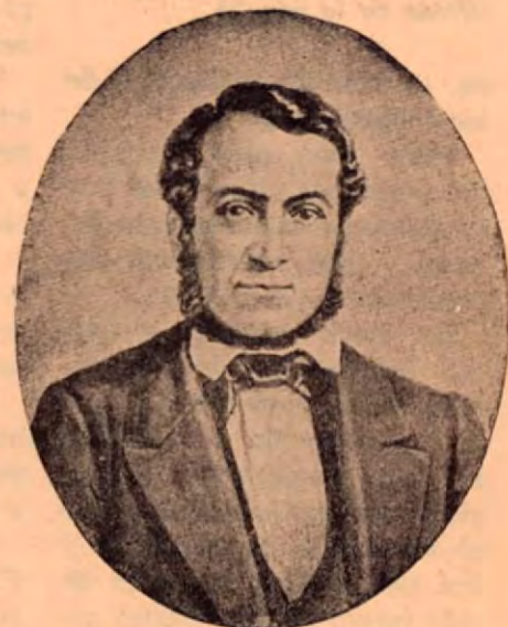
Don Juan Rafael Mora